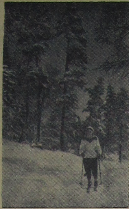
На лыжной прогулке.