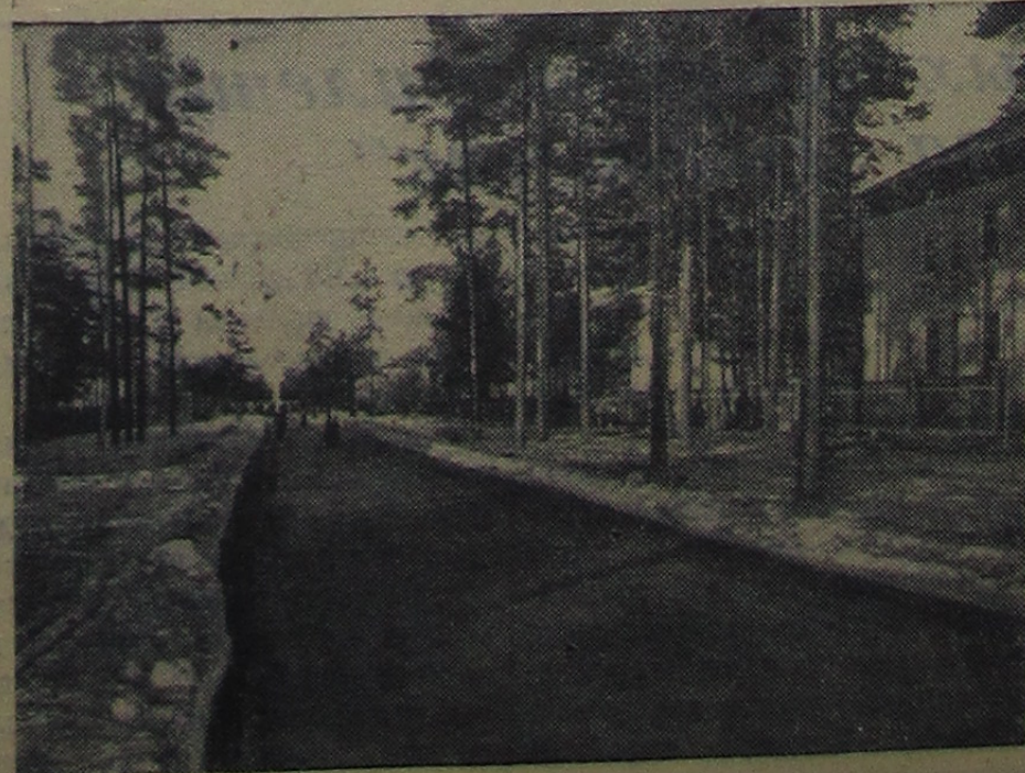
Центральная улица Дубны.

Начиная с 1 февраля всем подписчикам бывшей газеты «Московская правда» будет доставляться московская областная газета «Ленинское знамя».