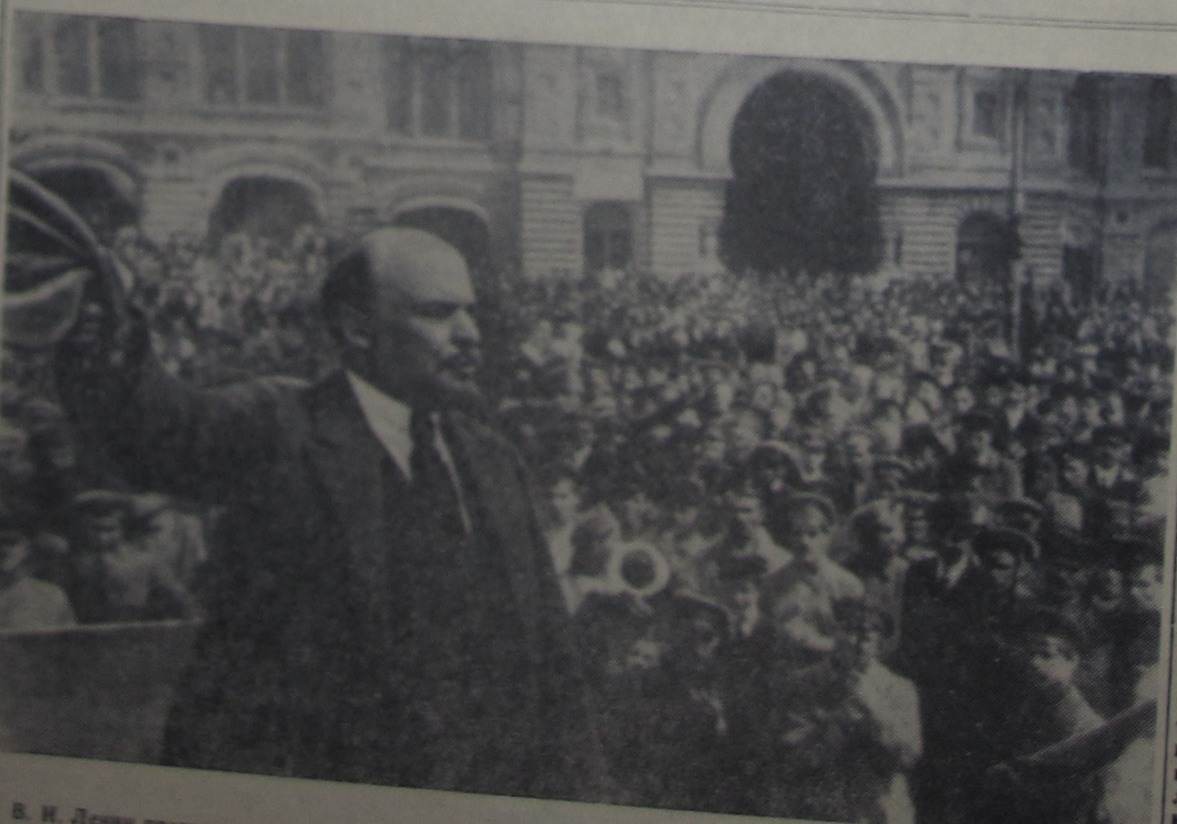
В. И. Ленин произносит речь перед войсками Всевобуча на Красной площади. Москва, 25 мая 1919 г.

Китай, как и Советский Союз, неустанно проводит политику мирного сосуществования двух систем, активно борется за мир во всем мире. Компартия Китая и китайский народ хорошо знают, что необходимо беречь единство социалистического лагеря, возглавляемого Советским Союзом. Мы навеки с вами вместе за прогресс, за мир и за наше общее дело! Группа китайских сотрудников Объединенного института ядерных исследований.