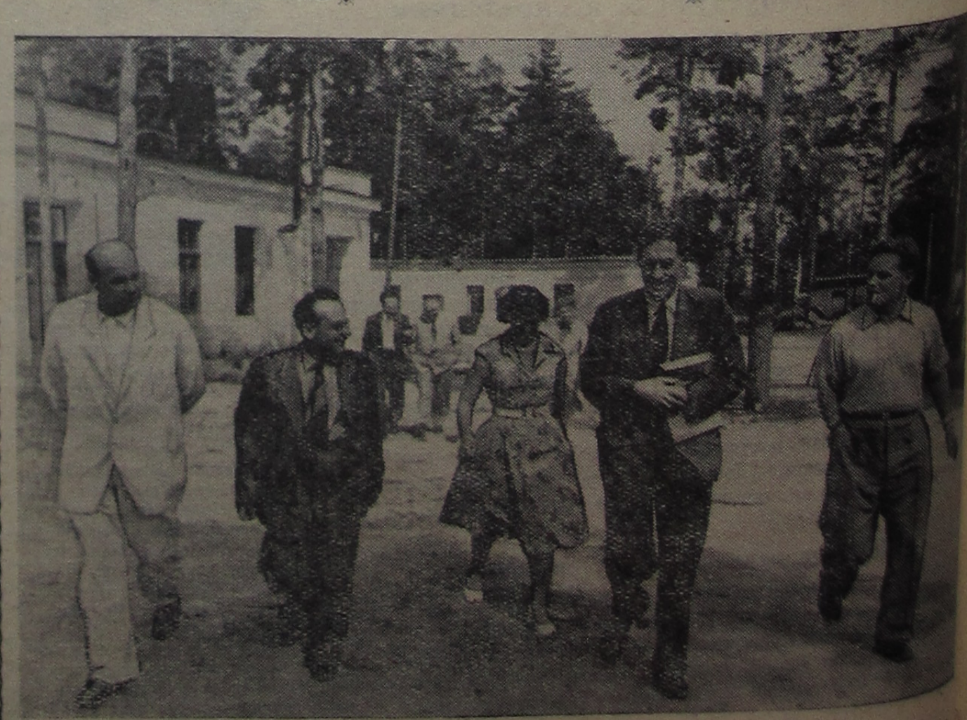
Посещение Объединенного института известным английским физиком-атомщиком, профессором П. Блэккетом.

ского народа за мирное объединение своей Родины. Мы считаем, что Организация Объединенных Наций, руководствуясь национальными чаяниями корейского народа и целью сохранения мира на Дальнем Востоке, должна при создавшихся условиях принять действенные меры и немедленно выводу американских и других иностранных войск из Южной Кореи и дать возможность корейскому народу решать самому свою судьбу. Мы горячо поддерживаем стремление корейского народа к мирному объединению Кореи и уверены, что корейский народ при поддержке других миролюбивых народов добьется осуществления этого справедливого требования. г. Дубна, 15—25 мая 1958 г. Письмо Д. Хаммаршельда Д. И. Блохинцева Генеральный секретарь Даг Хаммаршельд направил ректору Объединенного института проф. Д. И. Блохинцеву письмо, в котором, в частности, говорится: «После моего возвращения из Нью-Йорка из недавней поездки в Москву я хочу выразить сердечную благодарность Вам и Вашим коллегам за любезный прием, оказанный мне и сопровождающим меня лицам во время посещения вашего Института в Дубне. Я действительно был очень рад представившейся мне возможности встретиться с Вами и узнать непосредственно от Вас о чрезвычайно интересной и важной работе, которая проводится в области ядерных исследований в вашем Международном институте. Разрешите мне также передать Вас профессору Мещерякову и профессору Петухову искреннюю благодарность за большую любезность, проявленную во время экскурсии, и благодарность по циклотрону и фотопленке».