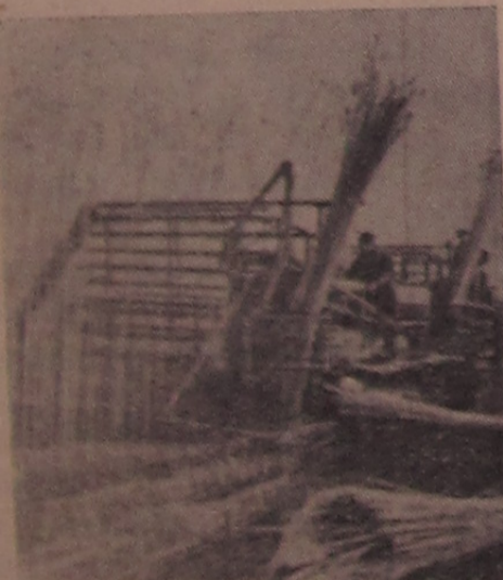
Румынская Народная Республика. Заготовка камня для строительных целей в дельте Дуная с помощью комбайна. В этом году собрано камня в два раза больше, чем в минувшем году.

Тысячи таких предприятий вступают в строй также во Внутренней Монголии, в Синьцзяне, Цинхэе и других районах КНР.