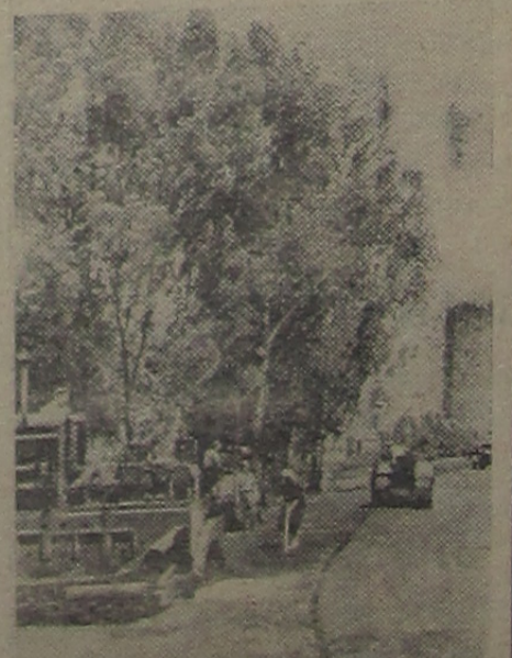
На снимке: асфальтирование улицы в селе Калиновке.

До Октябрьской революции село Калиновка Хомутовского района Курской области было типичным уголком нищей царской России.