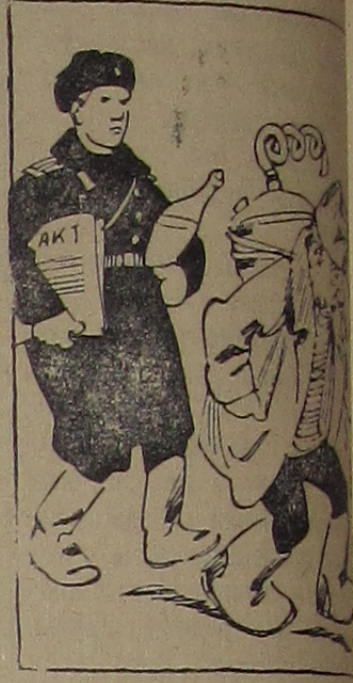
которых гонят мерзкое зло, о них мы расскажем в следующей раз.

Центральный Комитет Коммунистической партии Советского Союза и Совет Министров СССР в постановлении отмечают большие успехи во всех областях строительства. Из года в годное благосостояние трудящихся возмимой партией, правительством по коммунистическому не резко сократилась углубилась социалистическая советских граждан самоотверженно социалистического строительства обществу, свято с правилами социалистического общества. Однако, наряду с этим, имеются лица, которые не создания, появляются в нетрезвом состоянии хулиганские действия.