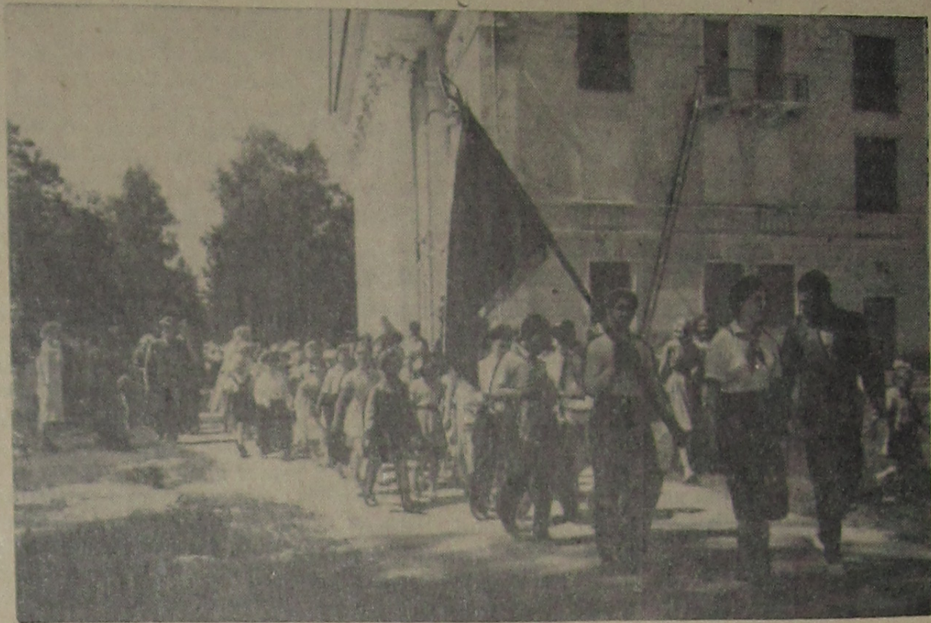
Лето пришло! Веселое пионерское лето! Двести сорок детей провожала Дубна 8 июня в новый пионерский лагерь. На снимке: колонна пионеров направляется к Волге, где ребят ожидает теплоход.