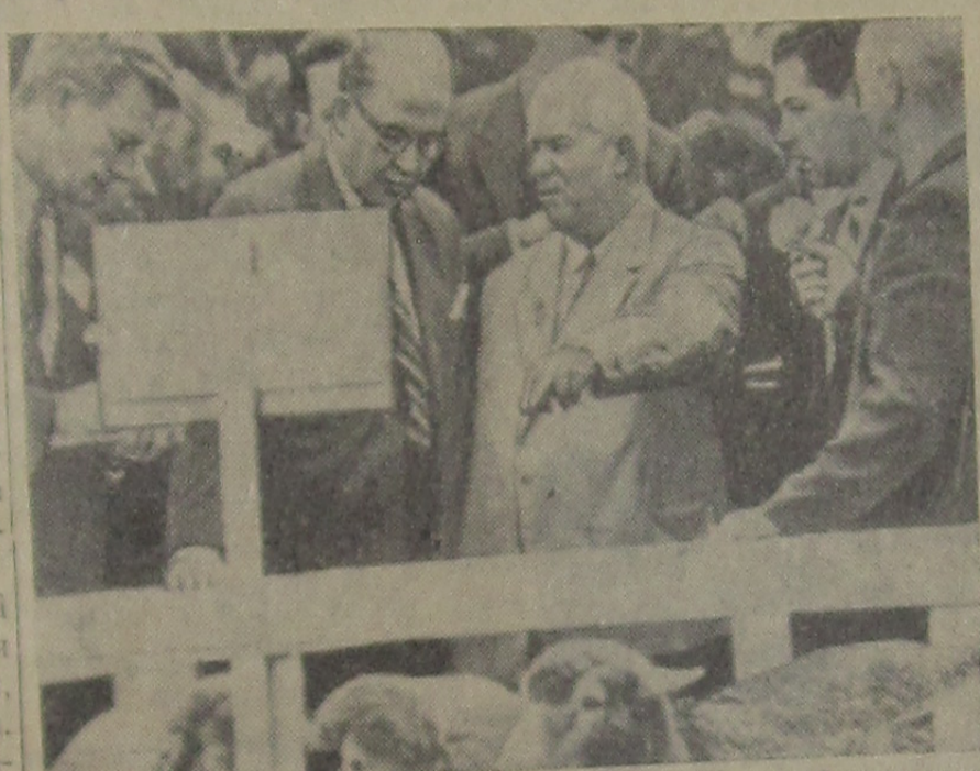
НА СНИМКЕ: Н. С. Хрущев на экспериментальной сельскохозяйственной станции в Белтсвиле (штат Мэриленд).

вуют благополучному исходу бесед руководителей СССР и США, несомненно, оказал бы огромное воздействие на потепление международного политического климата. Он, в частности, способствовал бы успеху совещания глав правительств. Он помог бы создать благоприятную атмосферу для плодотворной работы открывшейся в эти дни 14-й сессии Генеральной Ассамблеи Организации Объединенных Наций.