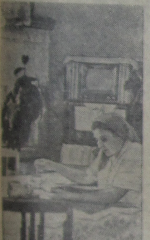
Вензенская область. Кураторы и машинисты живут колониями укрупненной сельхозартели имени Кирова Пензенского района. Головной доход колхоза достигнет 25 миллионов рублей. Здесь введена денежная оплата труда. Месячный заработок многих колхозников составляет тысячу и более рублей. В домах колхозников сельхозартели имеются радиоприемники, телевизоры, хорошая мебель, проведено электричество.

...и выписки до сих пор. Как видно, возникающие разногласия между ОЖКХ и райисполкомом не идут на пользу делу. Какие же выводы можно сделать из всех этих фактов? Прежде всего в работе жилищных комитетов, если в составлении дефектных ведомостей, ввиду с предвзвешенности ОЖКХ не принимается участие и районная ремонтная бригада (иногда ремонт будет осуществляться силами ремонтных) Кроме того, нам представляется целесообразным установить такой порядок, когда местными органами работы и предпринимать, скажем, диспетчерские от общей ответственности ремонта ремонтных бригад бы органы жилищных комитетов без согласия ОЖКХ, а уже более крупные работы должны санкционироваться жилищными отделами. Тогда можно, на мой взгляд, действительно решить многие жилищные вопросы. Очень важно привлечь к работе по ремонту жилищной коммунальной собственности жилищных комитетов жилищных коммунальных отделов и местных жилищных отделов, которые должны активно участвовать в распределении жилищных средств и сбором