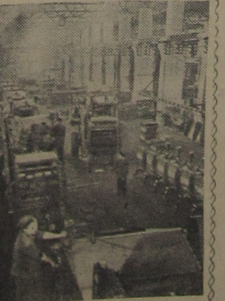
КРАСНОЯРСК. Коллектив комбайнового завода стремится достойно встретить предстоящий Пленум ЦК КПСС.

Начав в этом году серийное производство самоходных комбайнов СК-3, завод уже выпустил семь тысяч таких машин, досрочно выполнив годовой план. Комбайнстроители решили в подарок Пленуму ЦК КПСС дать до конца года еще полторы тысячи комбайнов.