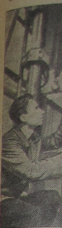
ЯРОСЛАВЛЬ... воде разработаны... пы шин высоко... Исследование ка... дукции проводи... ультразвука, ре... тивных изотопов... На снимке: ин... нов готовит к и... габаритную шину