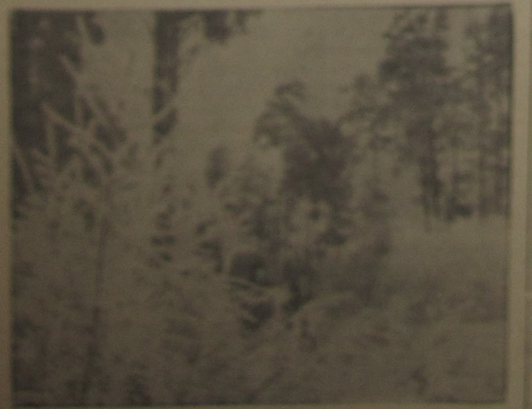
Видео В. Черныш.

15.30 — «Взгляд» (фильм) — А. С. Пушкин и его поэзия.