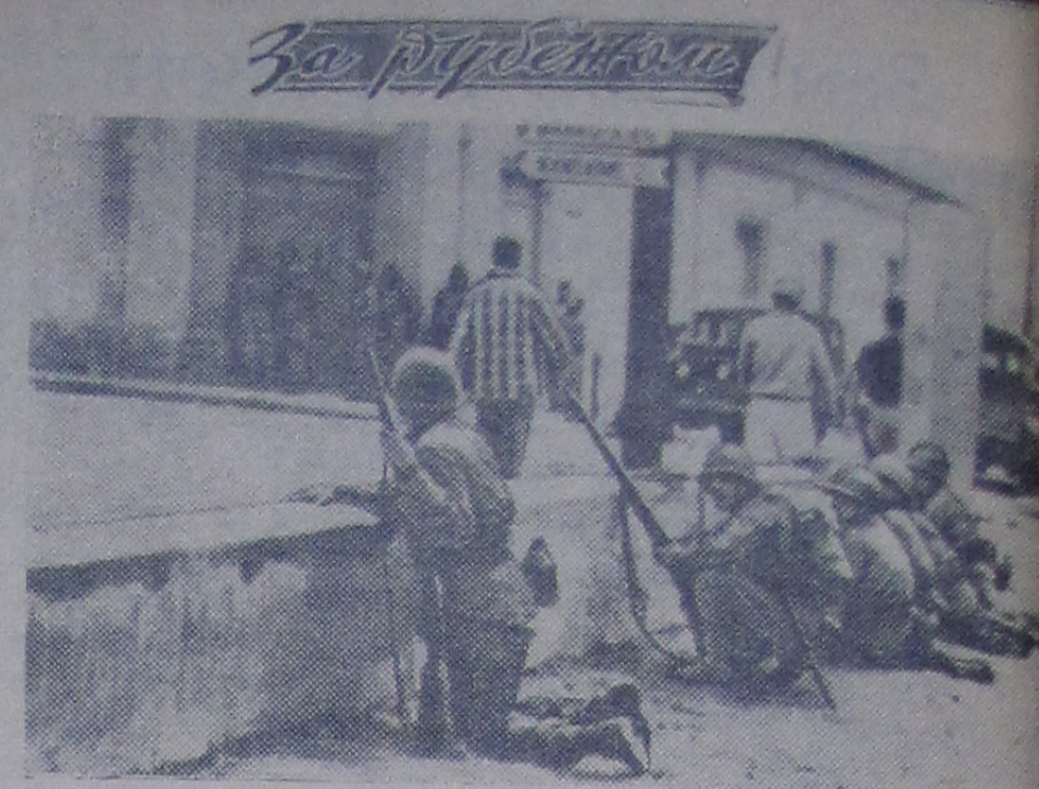
К СОБЫТИЯМ В НИКАРАГУА. В стране развернулось движение против диктатора Сомосы. Власти ввели в городах военное положение. Между повстанцами и войсками произошли столкновения.

Елка у нашей детворы будет яркой и нарядной.