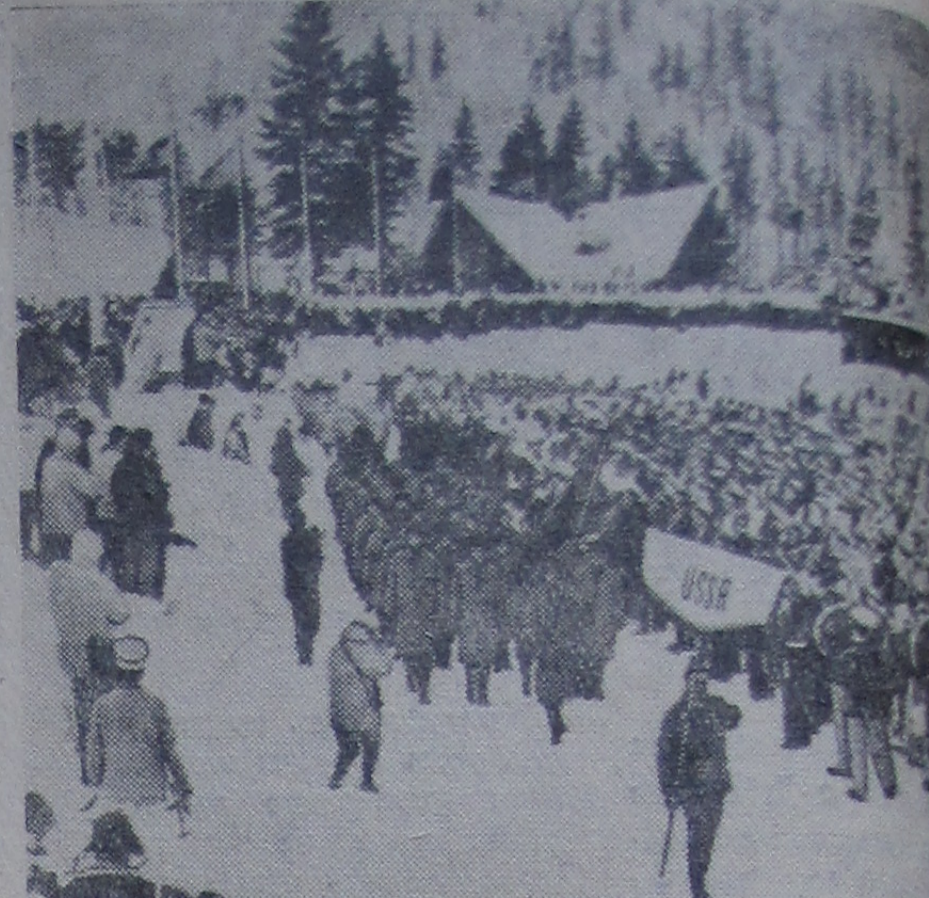
США. СКВО ВЭЛЛИ. Советская команда на торжественной церемонии открытия VIII зимних олимпийских игр.