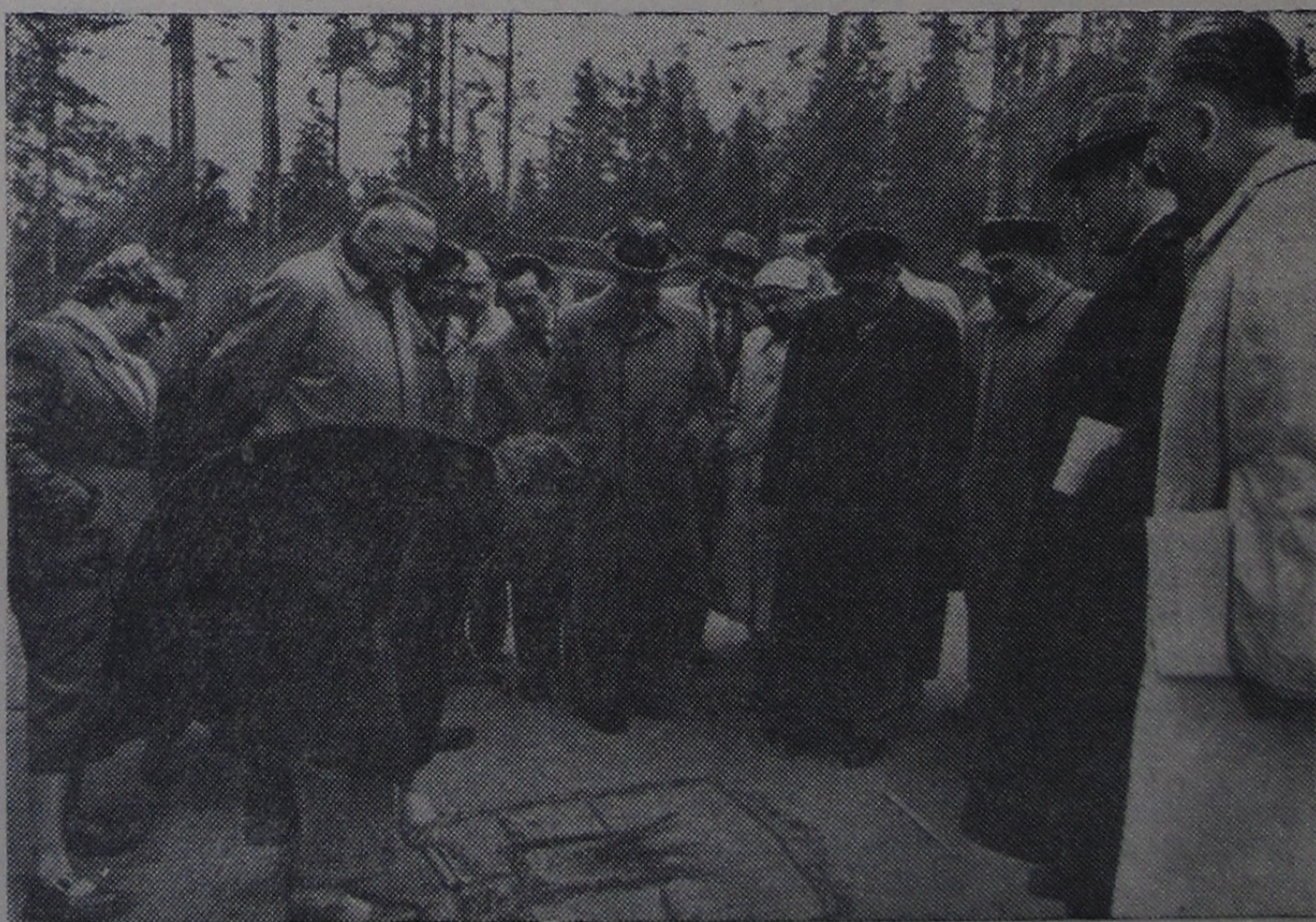
Фотоснимок удостоен третьей премии на фотоконкурсе редакции газеты «За коммунизм» в 1959 году.