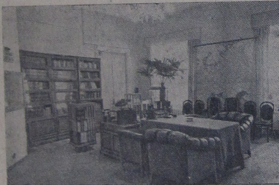
Москва. Кремль. Рабочий кабинет В. И. Ленина.

МНЕ, молодому члену партии, выпало огромное счастье в годы революции работать под непосредственным руководством Владимира Ильича: в 1917—1918 годах в качестве секретаря Совнаркома, а с конца 1920 года — в качестве управляющего делами Совнаркома. Исполняя десятки текущих поручений Владимира Ильича, я имел возможность близко, изо дня в день наблюдать его работу.