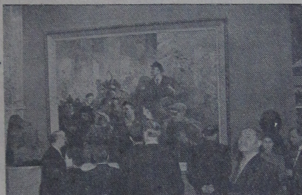
Москва, В Центральном выставочном зале открылась художественная выставка «Советская Россия». На снимке: посетители у картины художника Н. Бабюка «Ленин».

Однако, глядя на эту вую молодежь, с глубокостью чувствуешь, что д ляг сочтены, что их день становится все меньше эти уроды в прекрасной ветской молодежи не мтвность ее стремлению не прекрасному, к настоящей культуре.