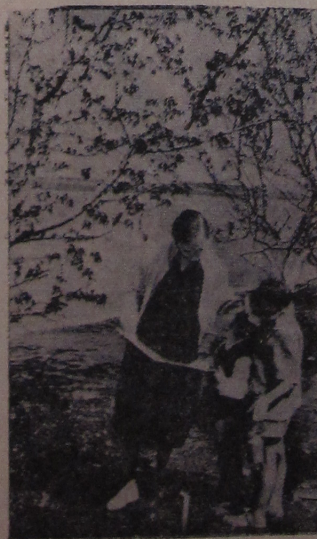
Интересная книга.

В связи с исполняющимся сегодня 50-летием, городская профсоюзная библиотека подобрала материал о жизни и творчестве А. Твардовского. Читатель сможет взять произведения поэта, а также литературу о нем.