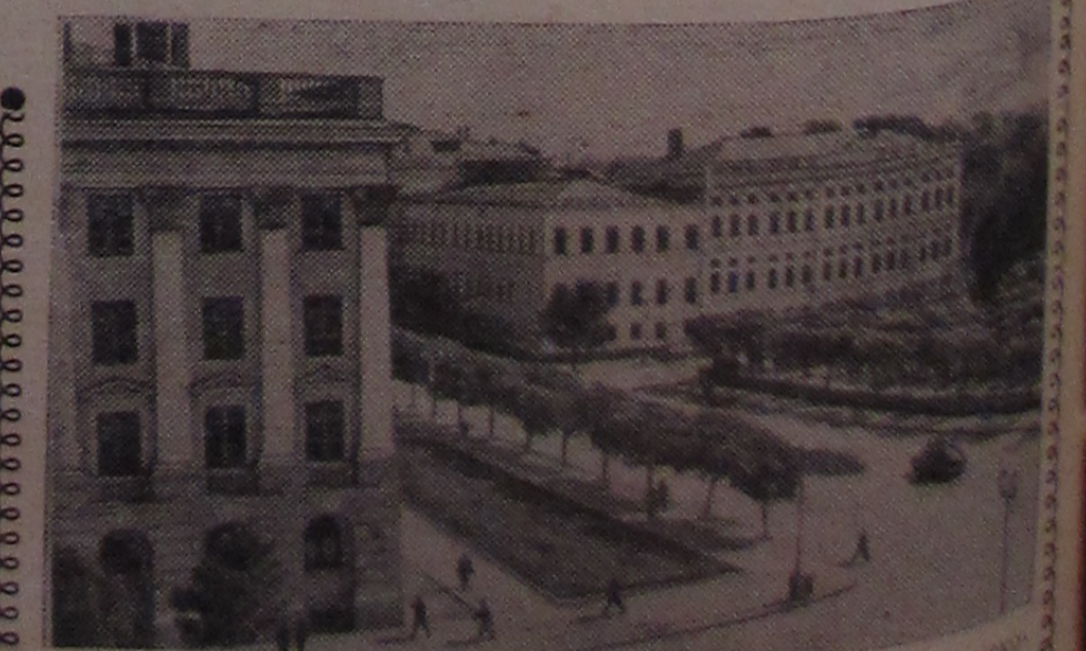
Казань. Слева — корпус химического факультета Казанского государственного университета имени В. И. Ульянова-Землинна, справа — здание Академии наук СССР (Казанский филиал).