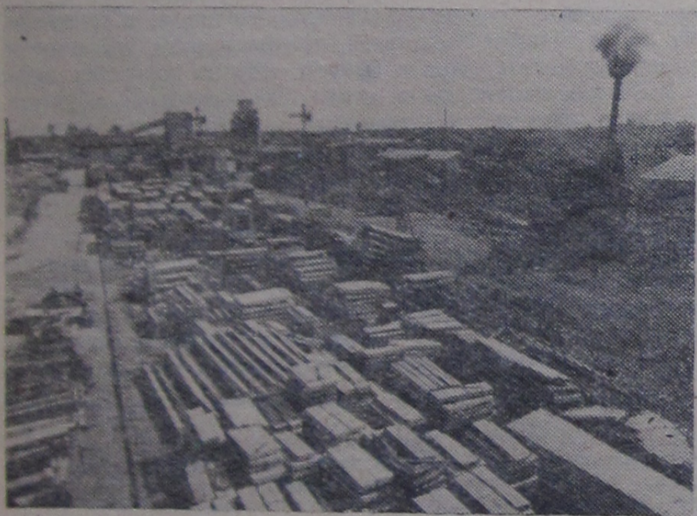
Сердце строительства — так можно назвать производственные предприятия. Отсюда строительные участки получают железобетонные и стальные изделия, различные растворы, перегородки, в общем, все то, что затем собирается и устанавливается в строящихся жилых домах, лабораториях, культурно-бытовых учреждениях.