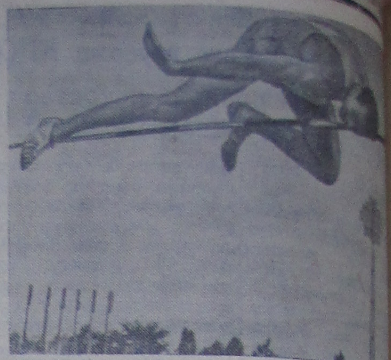
СОФИЯ. Всемирные студенческие летние спортивные игры. На снимке: советский спортсмен Валерий Брумель установил новый мировой рекорд по прыжкам в высоту, прыгнув на высоте 2 метра 25 сантиметров.