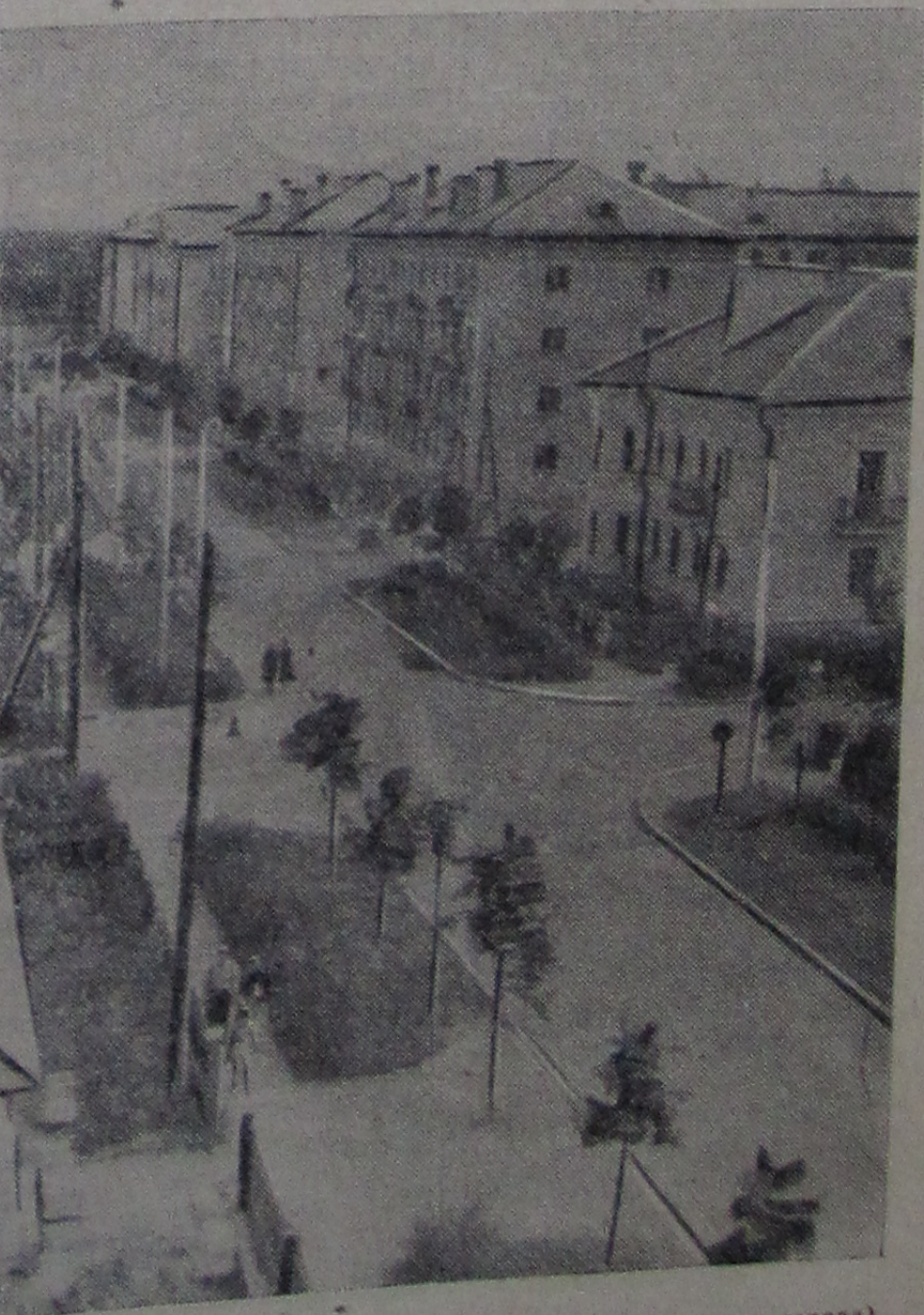
Новые дома на Инженерной улице. (Институтская часть города).

Сейчас автомобиль «Москвич-408» проходит государственные испытания по дорогам Советского Союза, после чего он будет пущен в серийное производство.