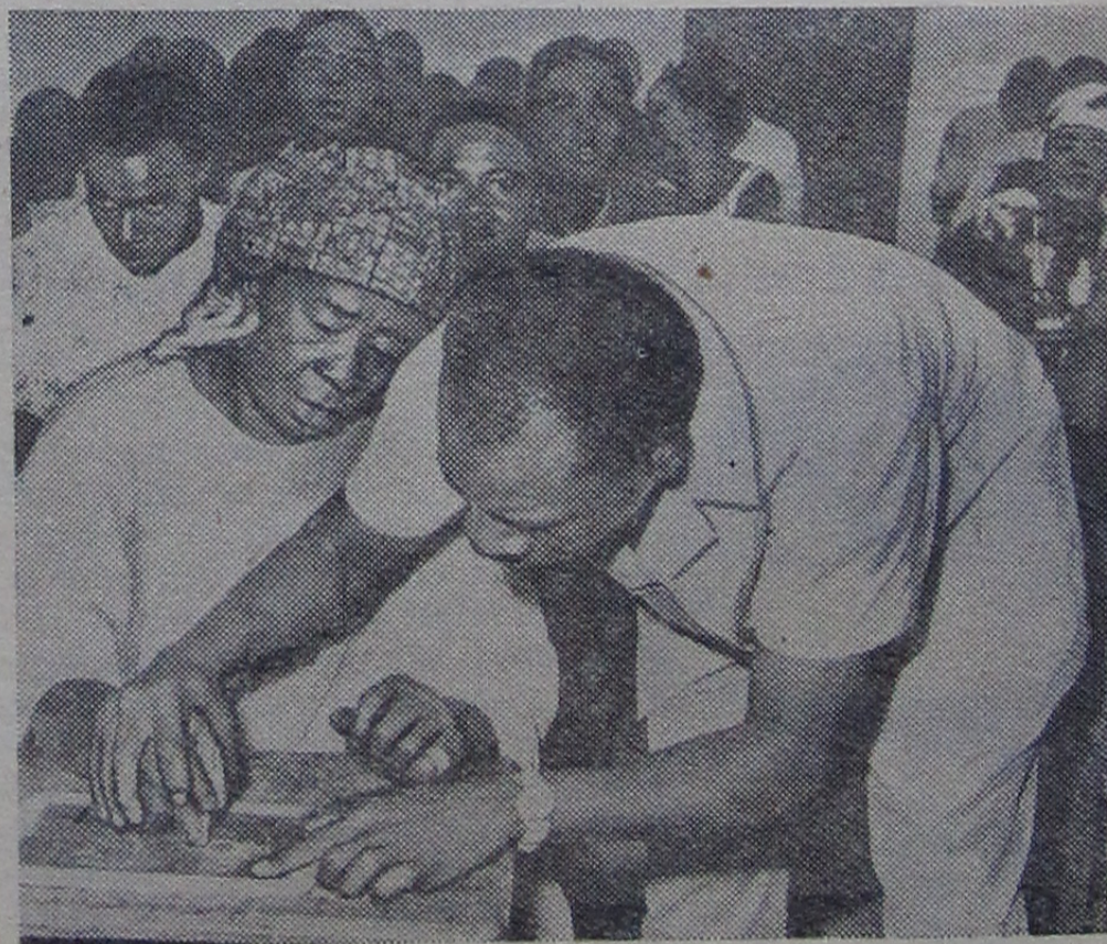
В Мали при колониальном режиме 92 процента населения было неграмотно. Сейчас правительство страны способствует движению за ликвидацию неграмотности. На снимке: в вечерней школе в Бамако.