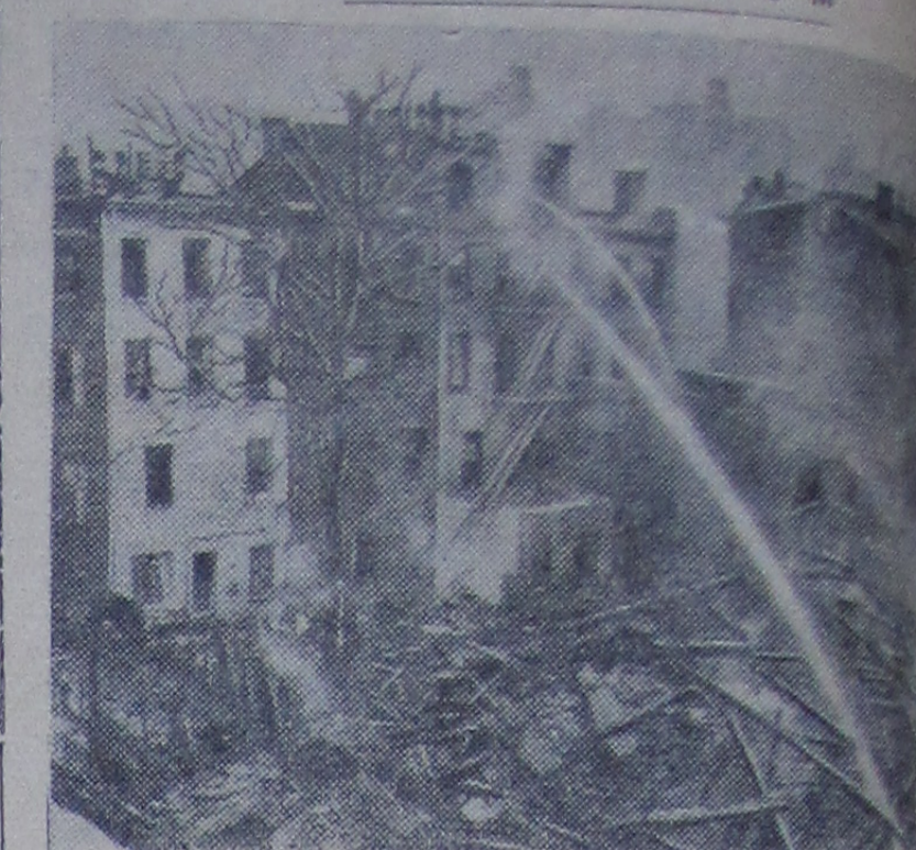
В Нью-Йорке недалеко от центра города. Два самолета на борту которых находились представители различных организаций, упали на улицы.

На снимке: место падения одного из самолетов.