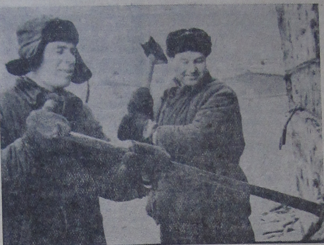
КАК ТОЛЬКО приходит зима, в Большеволжском аванпорту вырастает целый городок из речных судов. В этом году здесь зимует 48 судов. Их экипажи совместно с работниками отстойно-ремонтного пункта проводят ремонт барж, катеров и парохода.

Нет никаких сомнений, что труженики нашего города с честью справятся с возложенными на них задачами, тем самым внесут свой достойный вклад в выполнение плана третьего года семилетки. Ознаменуют XXII съезд родной партии замечательными трудовыми достижениями.