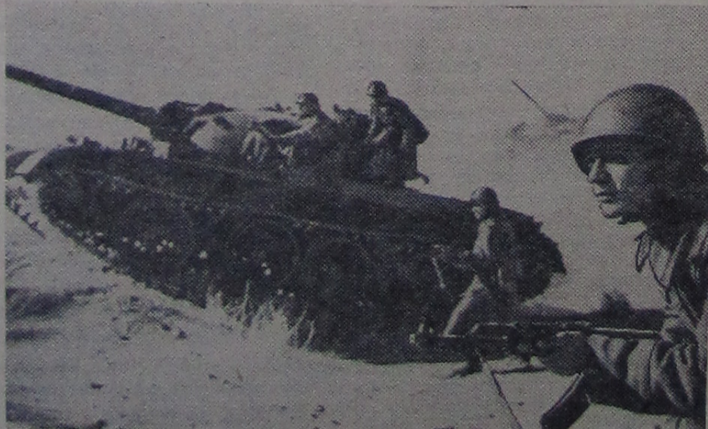
В Н-ской части на тактических занятиях