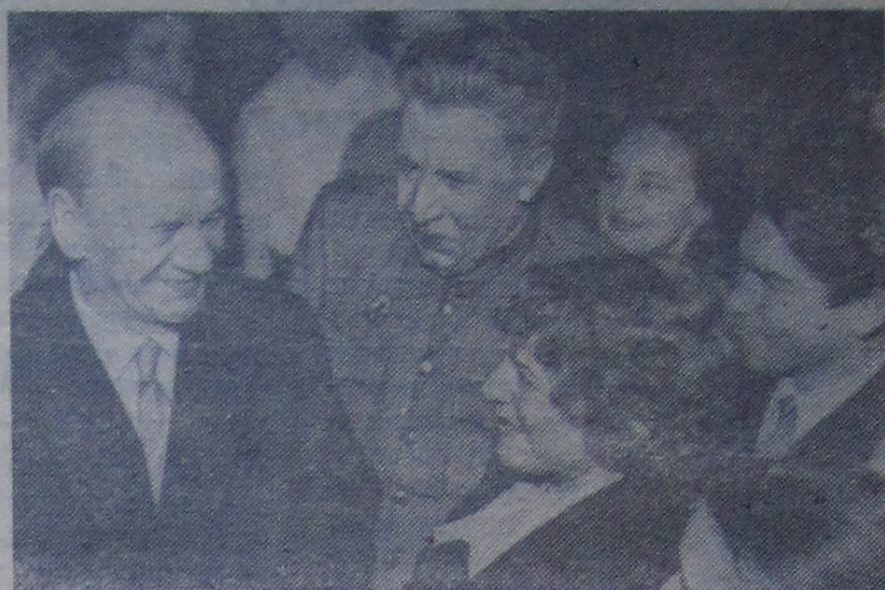
МОСКВА. В Доме культуры завода «Станколит» состоялся творческий отчет Академии художеств СССР, посвященный XXII съезду КПСС.

На снимке: президент Академии художеств СССР, народный художник СССР В. В. Иогансон беседует с участниками встречи.