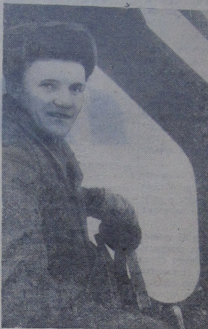
КВАРТАЛ за кварталом встанут новые корпуса жилых домов, школы, детские сады, ясли в нашем городе.

Приветственными телеграммами по случаю 15-летия Договора о дружбе и взаимопомощи между СССР и МНР обменялись также министр иностранных дел СССР А. А. Громыко и министр иностранных дел МНР П. Шагдару-рэн.