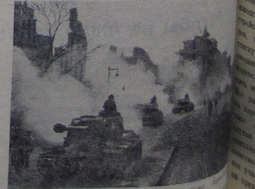
В Берлине. Советские танки проходят мимо Рейхстага.