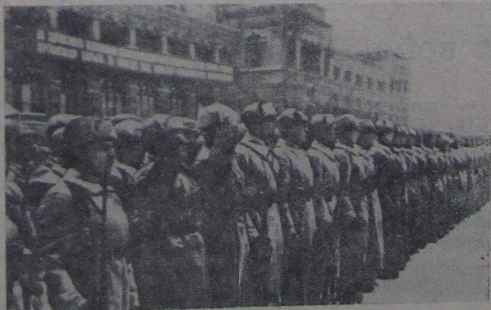
Начало Великой Отечественной войны Советского Союза против фашистской Германии. Военный парад на Красной площади 7 ноября 1941 года.

В решении, принятом комитетом, записано: для повышения качества выпускаемой продукции провести квалификационную переквалификацию рабочих, способных по изучению ведущих технологий.