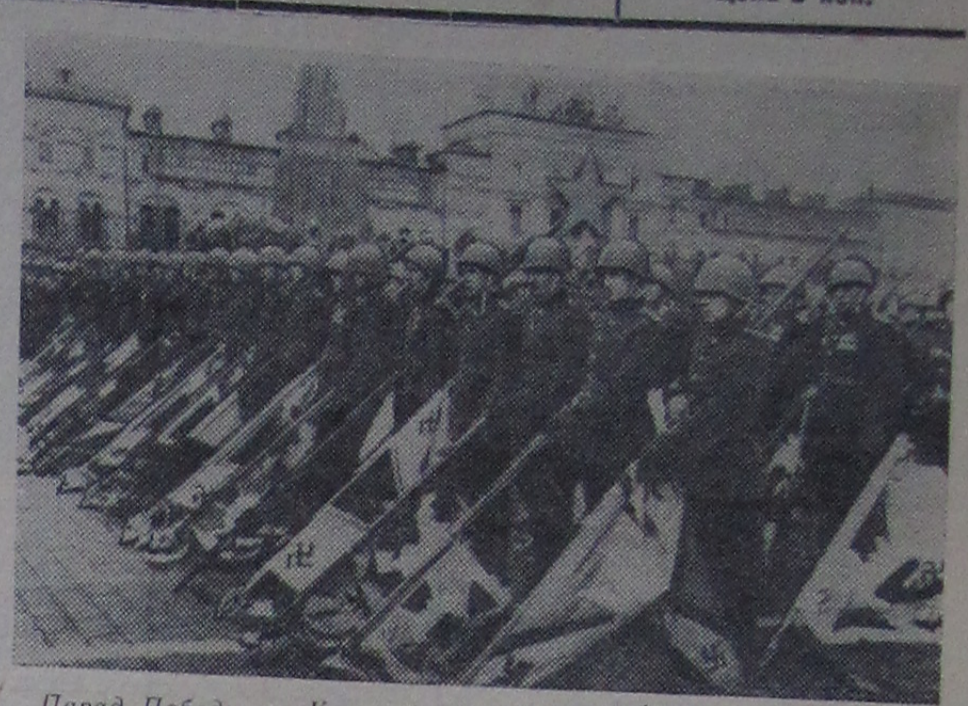
Парад Победы на Красной площади в Москве 24 июня 1945 г. На снимке: советские воины с захваченными у немецких войск знаменами.

Никите Сергеевичу Хрущеву мы шлем наш рабочий привет и поздравление с высокой наградой, — говорят передовики производства левобережной части города.