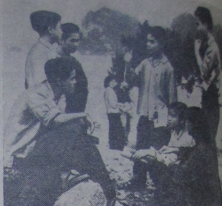
ДЕМОКРАТИЧЕСКАЯ РЕСПУБЛИКА ВЬЕТНАМ. На берегу залива Алон.