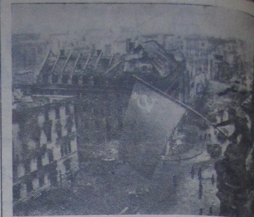
Водружение знамени Победы над Рейхстагом. 1945 год.