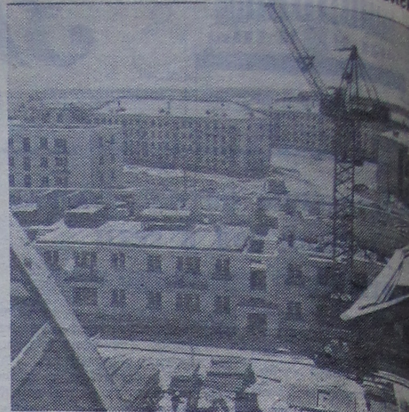
Коллектив ударной комсомольской стройки — Балазовского комбината искусственного волокна в Саратовской области готовит трудовые подарки XXII съезду КПСС.

К открытию съезда решено пустить опытную установку производства кордового волокна, смонтировать первый агрегат высокого давления строящейся ТЭЦ.