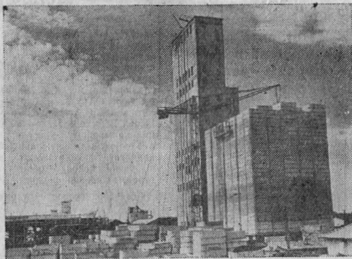
Челябинская область. На станции Субутан Южно-уральской железной дороги сооружается элеватор из сборных железобетонных элементов. Первая очередь будет сдана в эксплуатацию в этом году. На снимке: общий вид строительства элеватора.