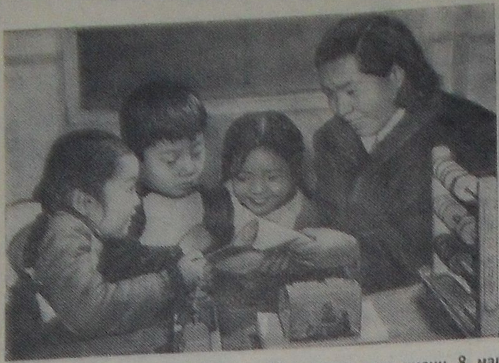
Китайская Народная Республика. В детском саду имени 8 марта в городе Тяньцзинь.