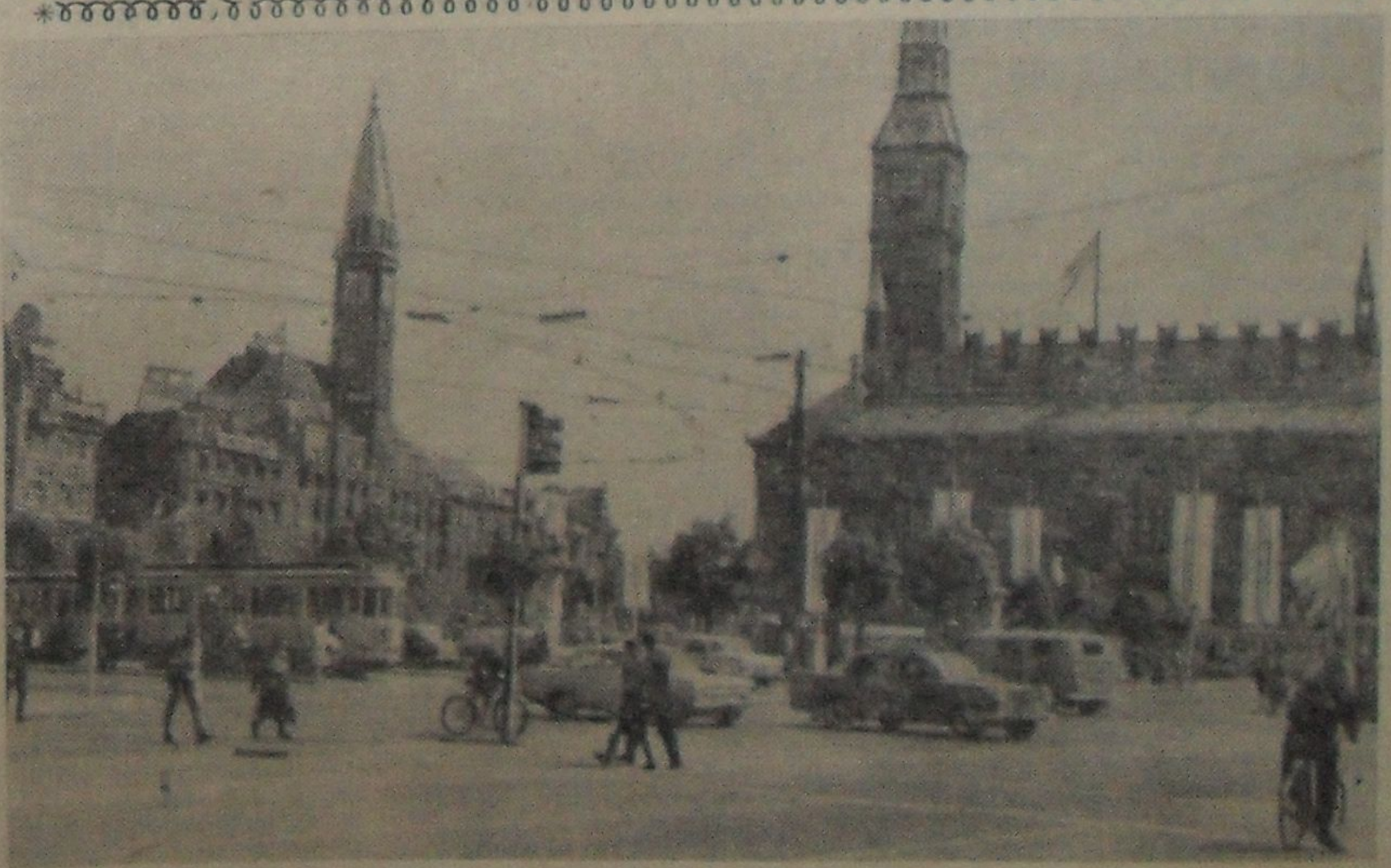
Копенгаген. Площадь Ратуши.