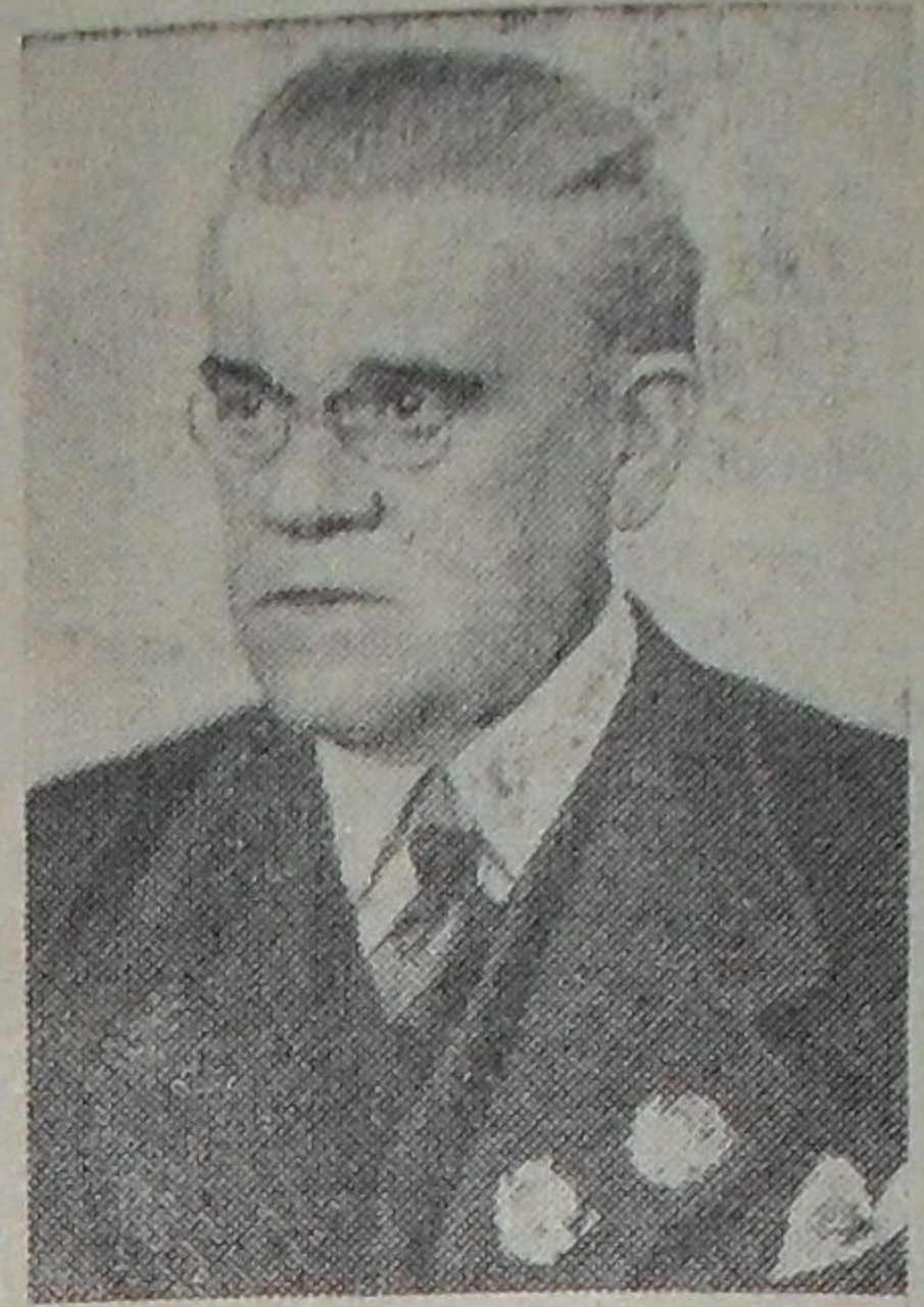
Москвин Иван Михайлович — великий советский актер.

Завтра исполняется 90 лет со дня рождения И. М. Москвина (1874), выдающегося советского актера, одного из создателей Московского Художественного театра.