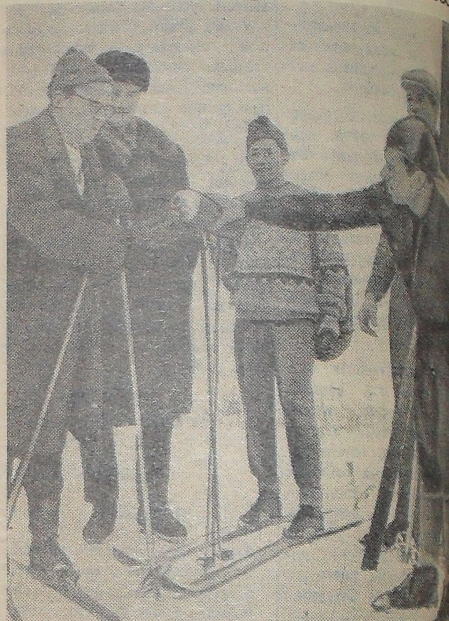
Стакан горячего чая, радостные улыбки товарищей — может быть приятнее после лыжного пробега!