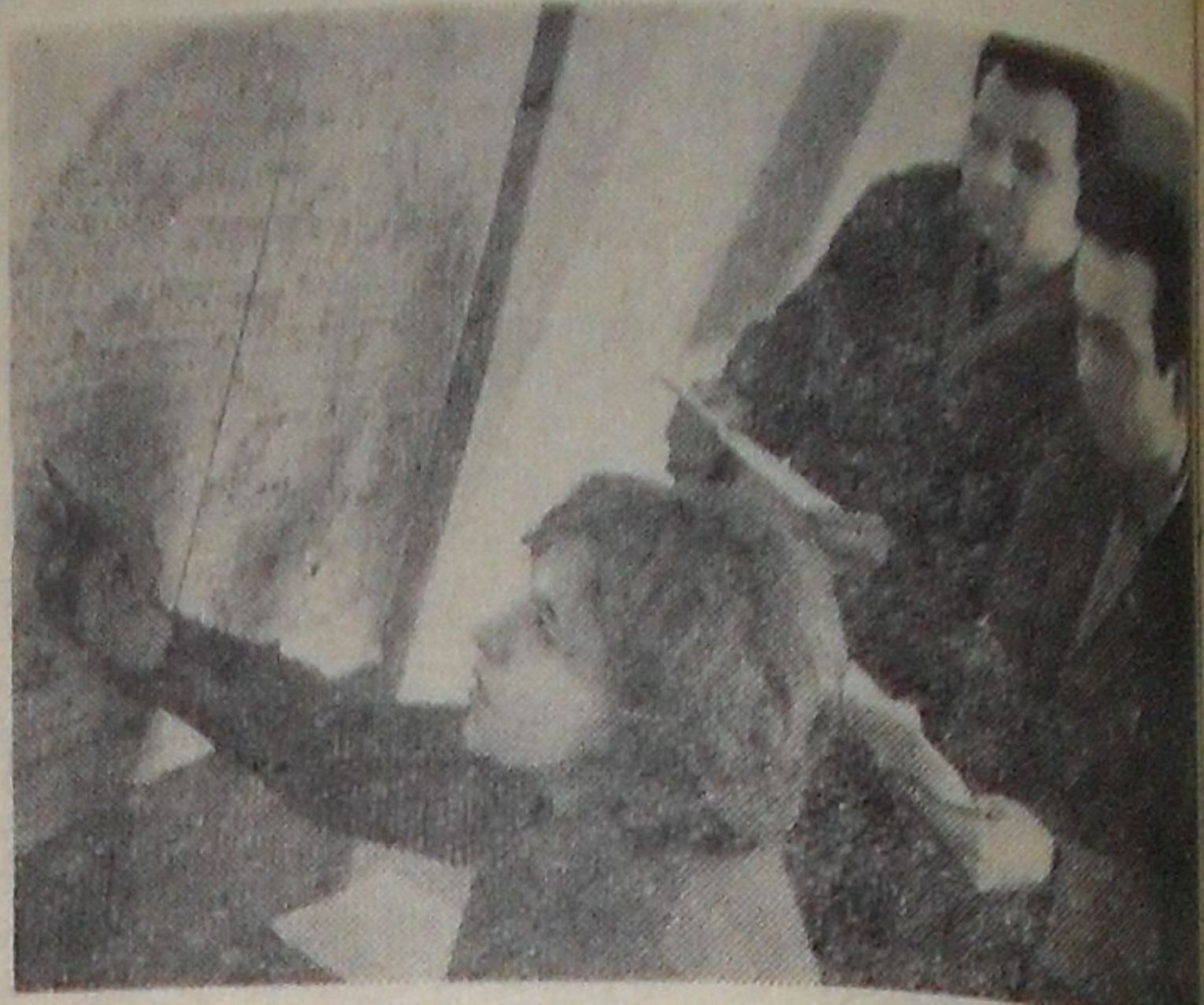
Агитаторы избирательного участка № 8.