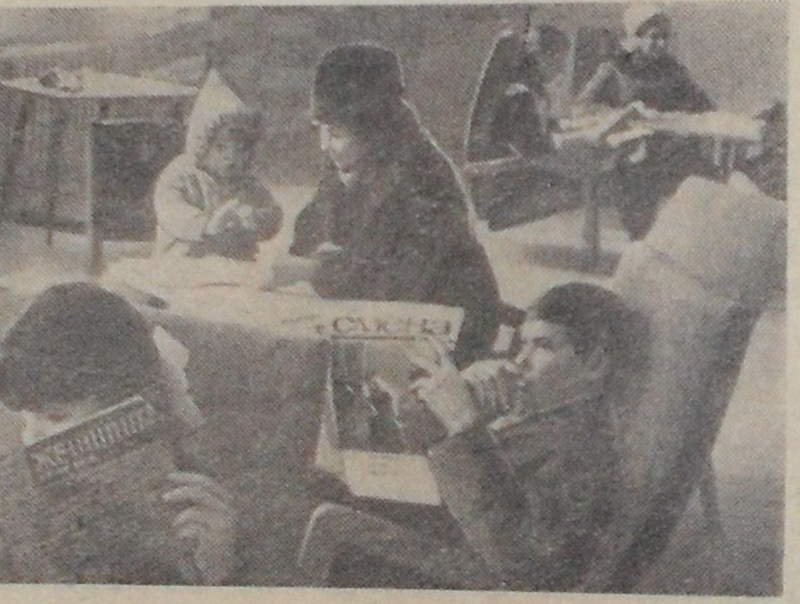
В Доме культуры дети могли в отведенной им комнате почитать книги, журналы, поиграть в игры. Тут же работает детский буфет.