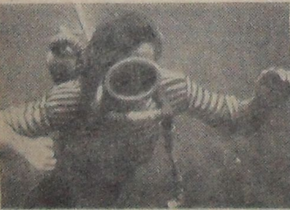
Глубина 15 м.