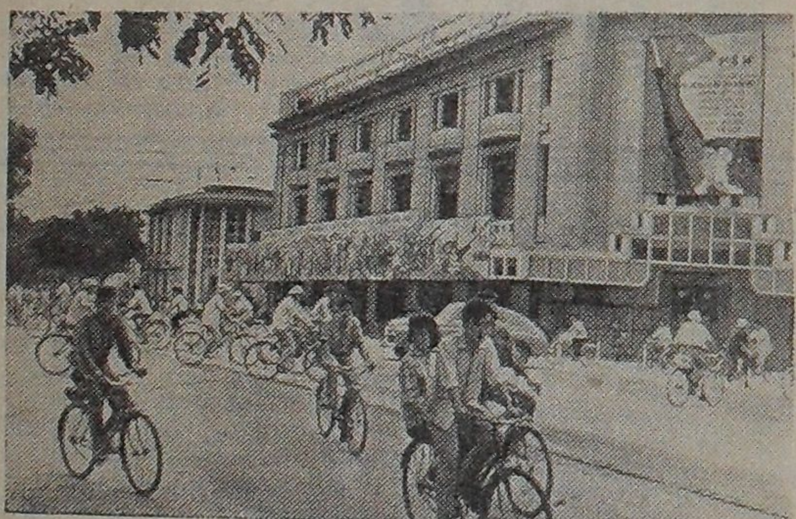
Столица Республики — Ханой.