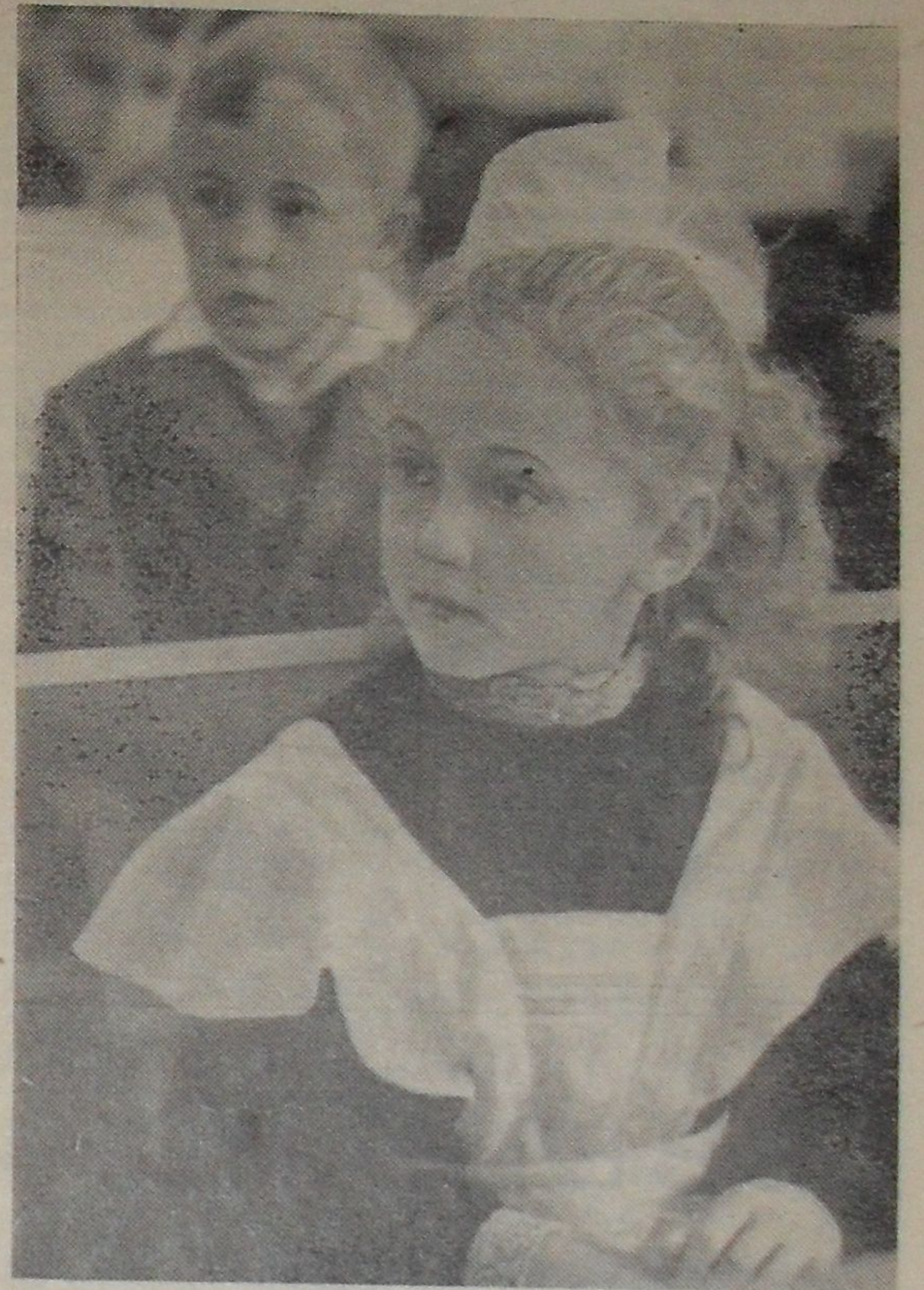
68 миллионов человек, почти третья часть населения нашей Родины, учится. Таких показателей не знает ни одна капиталистическая страна.