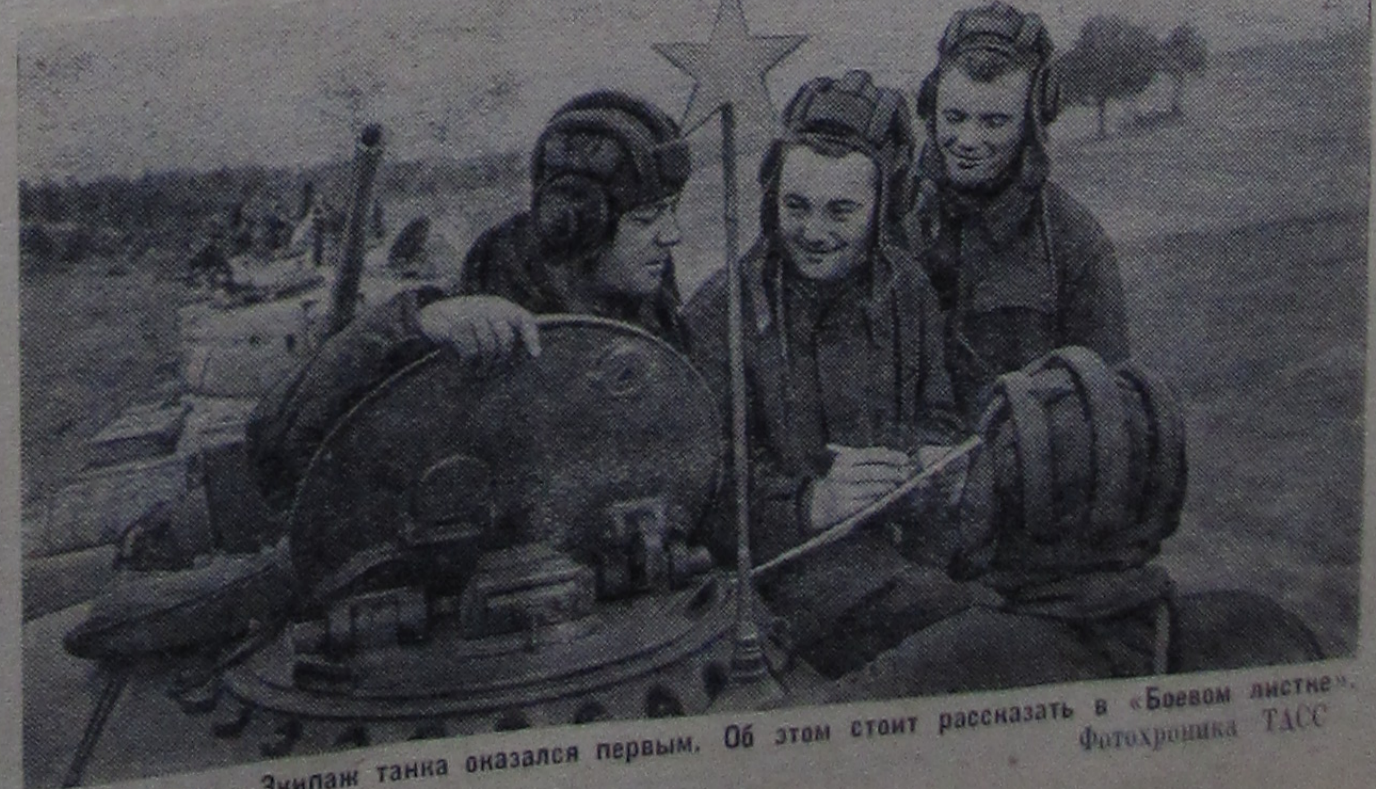
На учениях... Знпиаж танка оказался первым. Об этом стоит рассказать в «Боевом листке».