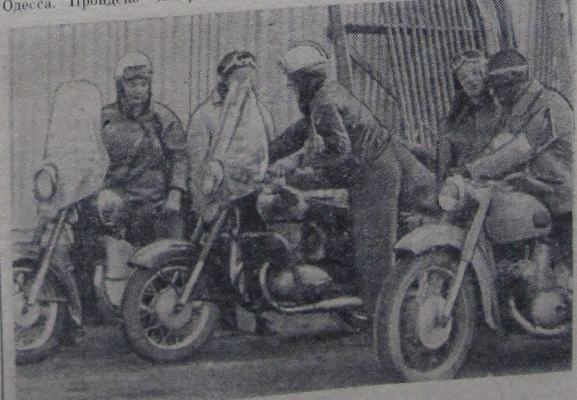
Наша группа мототуристов.