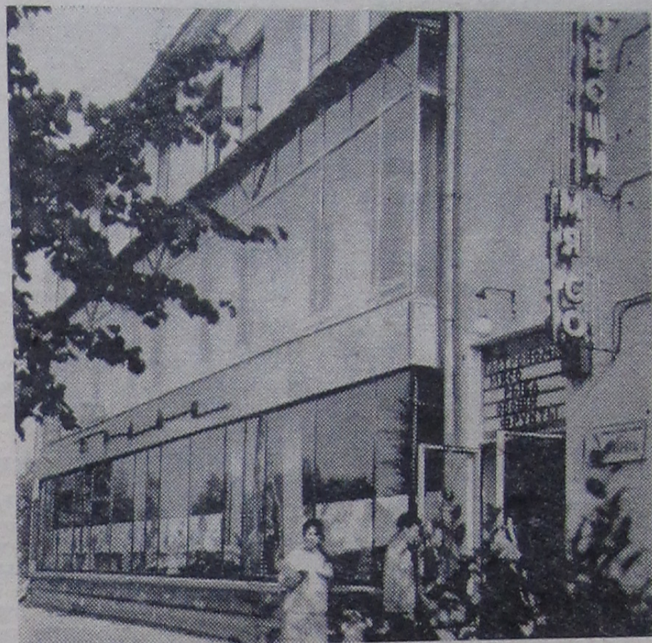
Инженерная улица. Магазины «Дубна».