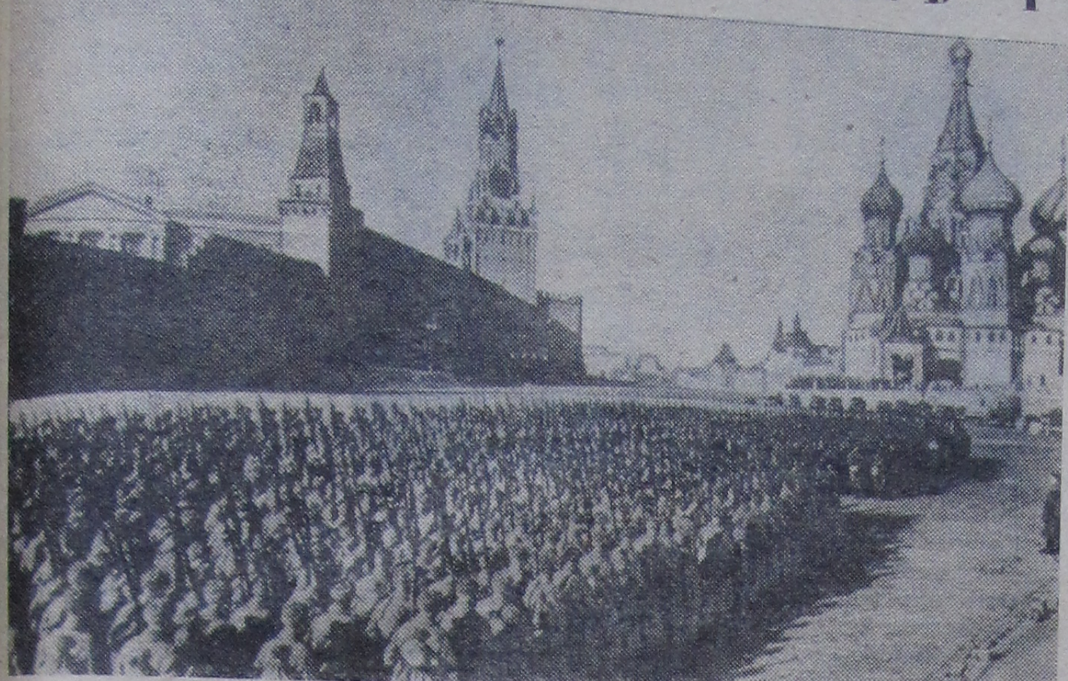
Защитники столицы направляются на фронт.