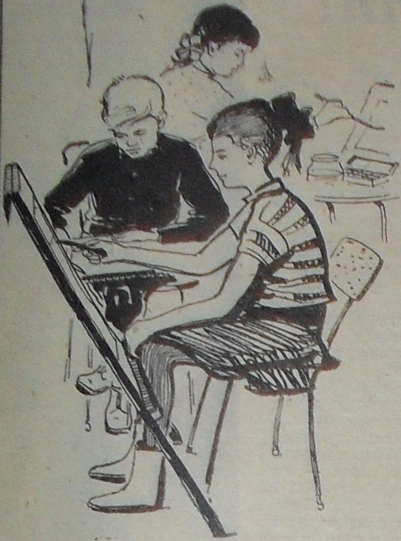
Юные художники Рис. Ю. Сокина.

В 1967 году в Дубне будет организован топливный склад. При организации склада будут учтены предложения по использованию отходов, образующихся на заводе железобетонных и деревянных конструкций.