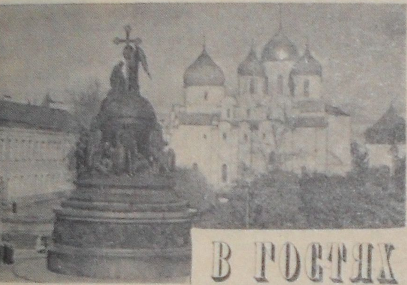
«Где святая София, тут и Новгород».