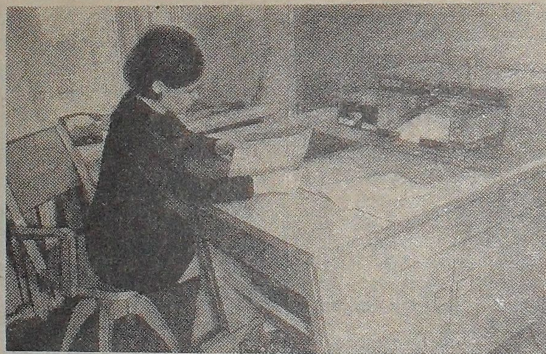
Новая техника в издательском отделе Института. Автоматическая копировальная машина «Ксерокс» изготовила уже более 100 тысяч листов копий статей, рисунков, редких книг. Время изготовления одной копии — 9 секунд. Машина делает также печатные формы для ротатрипта.

член КПСС с 1942 г., орден ордена соц. дежурная общежития № 1.