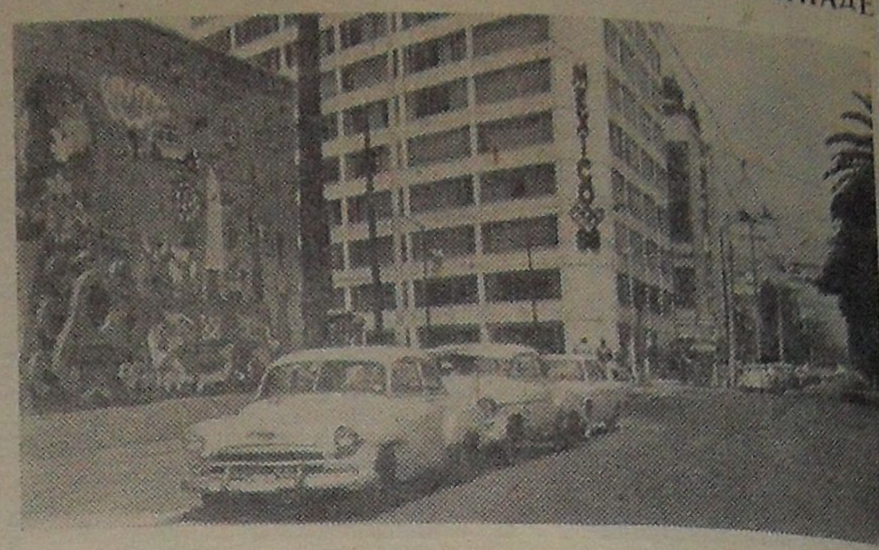
На снимке: олимпийская эмблема на улицах Мехико.

23 августа Новый художественный фильм «Убийца с того света» (Чехословакия). Начало в 19, 21 час. 24 августа Концерт молодежного эстрадного ансамбля Тбилиси. Начало в 20 час. 24—25 августа Новый художественный фильм «Ты моя жизнь» (Индия). Две серии в одном сеансе. Начало сеансов 24 августа в 17 часов, 25 августа — в 17, 20 час.