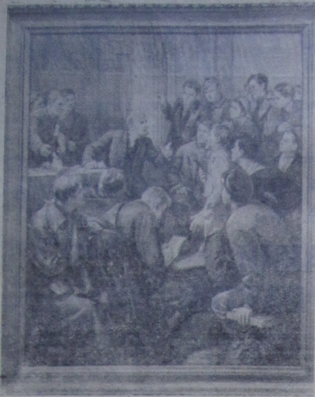
На снимке: «В. И. Ленин среди делегатов III съезда РКСМ» (с картины художника П. Белоусова).