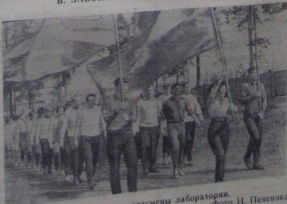
Идут спортсмены лаборатории.