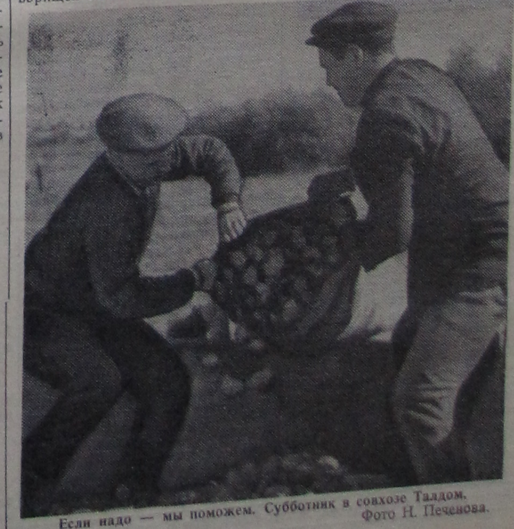
Если надо — мы поможем. Субботник в совхозе Таалдом.

30 октября состоялась отчетно-выборная профсоюзная конференция в Лаборатории высоких энергий. С отчетом о работе местного комитета выступил председатель месткома Г. А. Боков.