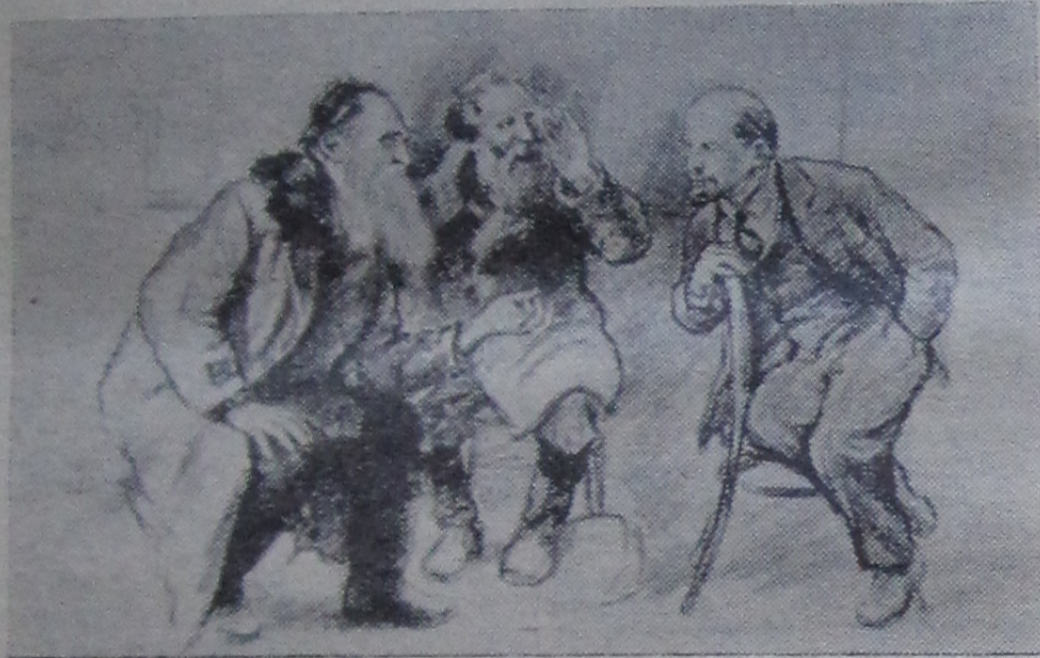
РАЗГОВОР ПО ДУШАМ