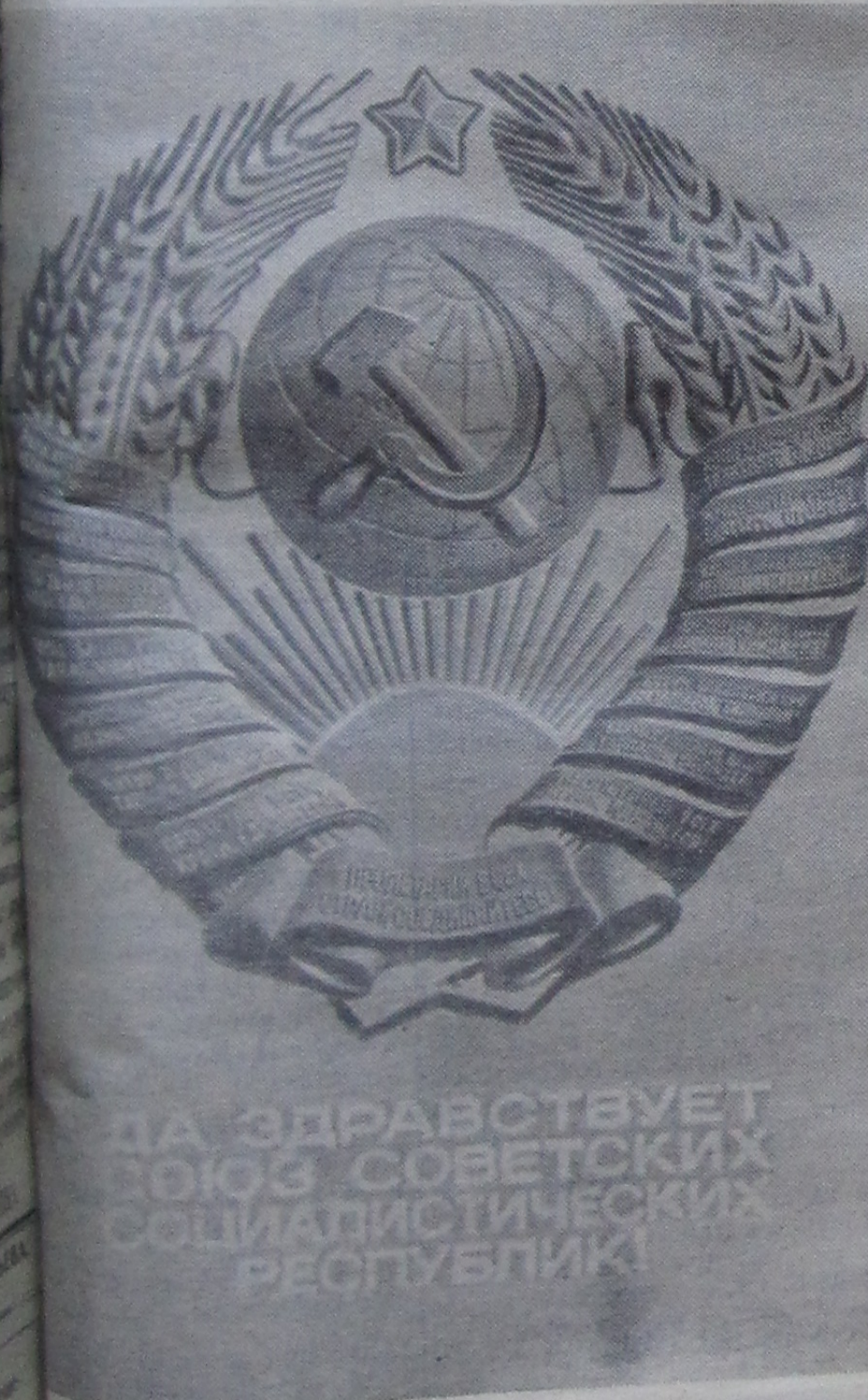
Работа художника В. Трухачева (издательство «Советский художник»).

всем укладом нашей жизни. Содержание и смысл социалистической демократии В. И. Ленин видел в тесной связи государственной власти с народом, в привлечении самых широких масс к управлению страной, хозяйственным строительством, общественными делами. Коммунистическая партия, осуществляя руководящую роль в строительстве нового общества, претворяя в жизнь ленинские заветы, всемерно развивает и совершенствует социалистическую демократию. Творчески обобщая опыт развития социалистической государственности, партия в Программе КПСС выдвинула положение об общенародном характере государства в развитом социалистическом обществе. Обеспечивая ведущую роль рабочего класса в жизни советского общества, партия добивается еще более широкого вовлечения всех слоев населения в дела государственного управления, всемерно активизирует и улучшает деятельность органов государственной власти — Советов, которые обогатились великим опытом диктатуры пролетариата и стали теперь всеохватывающей организацией народа, а также профсоюзов, комсомола и разнообразных демократических форм творческой самостоятельности масс. Делами Советского государства, делами общества действительно управляет народ. Нет ни одного законопроекта или решения, касающегося насущных интересов трудящихся, в разработке и осуществлении которого они не принимали бы участия. Пример Советского Союза, других социалистических стран убеждает трудящихся всего мира в том, что подлинную демократию обеспечивает только социализм.