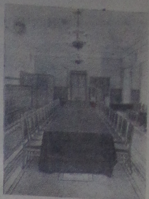
Здесь Владимир Ильич встречался с друзьями, товарищами, гостями — руководителями коммунистических партий — делегатами конгрессов Коминтерна.

Самая маленькая комната в квартире Ленина служила общей столовой, где в свободные вечера собиралась вместе вся