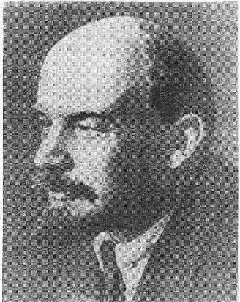
В. И. Ленин. Москва, февраль 1920 года

Под знаменем марксизма-ленинизма, под руководством Коммунистической партии вперед по ленинскому пути к коммунизму!