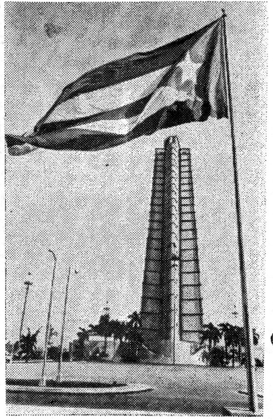
Самое высокое сооружение Гаваны — 125-метровый памятник национальному герою, выдающемуся революционеру и мыслителю Хосе Марти.