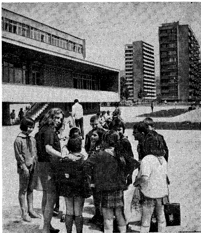
ЮНЫЕ ГРАЖДАНЕ БОЛГАРИИ.

Наша комсомольская организация в Дубне, в которую входят и научные сотрудники, и школьники, всегда участвует в субботниках, в подготовке праздничных вечеров, шефствует над своим клубом. И мы очень рады, когда наши праздники вместе с нами отмечают друзья — советская молодежь.