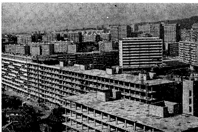
Новый жилой квартал в Софии «Молодость».