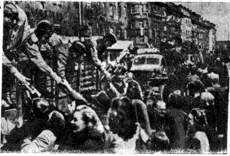
Изгнав врага с родной земли, советские воины продолжили освободительную миссию, помогли народам многих стран Европы избавиться от фашизма. На снимке: сердечная встреча советских воинов-освободителей в Чехословакии.

Пустой рукав. Чуть вздернуто плечо. На пиджаке, притягивая взгляды, Под майским солнцем светят горячо В честь праздника надетые награды. Их тонкий звон с годами не угас, Как не угасла боль в руке калечной... Мужская скорбь приводит каждый раз Его к друзьям, зарытым здесь навечно. Тех грозных лет потери нелегки, Холмов-могил не счесть на поле боя. Он жив остался. Хоть и без руки, Домой пришел со славою фронтовую. А их, друзей, у Волги и Днепра, У Вислы и у Одера скосило... Прошли года, но словно бы вчера Взрывался залп над свежей могилой. И вот теперь, который год подряд, От горечи хмеля неизбывной, Приходит к павшим воинам солдат, Стоит, седой, как памятник гранитный.