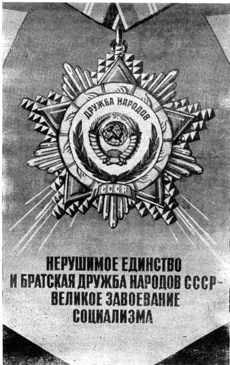
Плакат к Дню Конституции СССР (издательство «Плакат»).