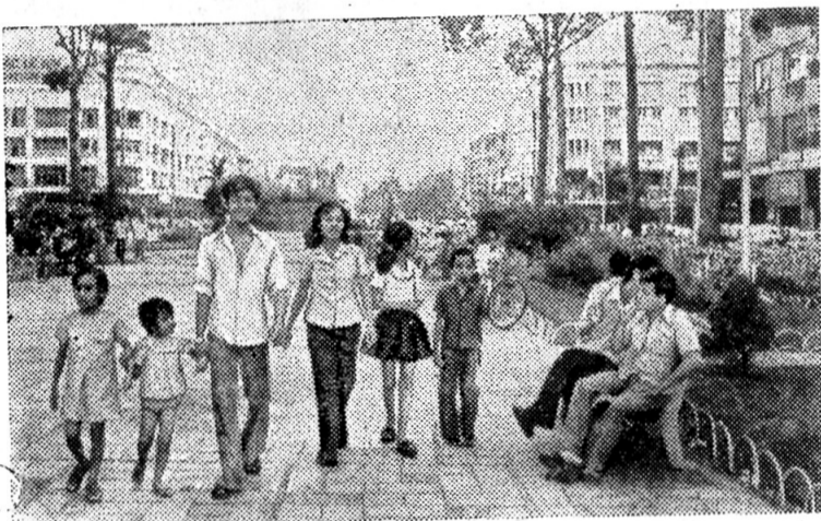
Широкие масштабы определяют сегодня облик крупнейшего города юга страны, носящего имя вождя вьетнамской революции Хо Ши Мина.

Наши туристские впечатления вряд ли добавят много нового к рассказам о Вьетнаме, его городах и людях — для того, чтобы по-настоящему рассказать об этом, надо жить здесь не девять дней, а гораздо дольше. И все же, повторю, главное впечатление — это дружелюбие и приветливость вьетнамцев. Всех без исключения, кого мы встречали в эти дни.