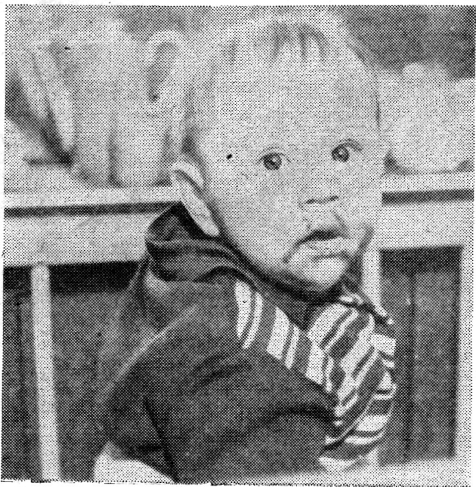
Я ЖЕ ТОЛЬКО ПОПРОБОВАЛ!