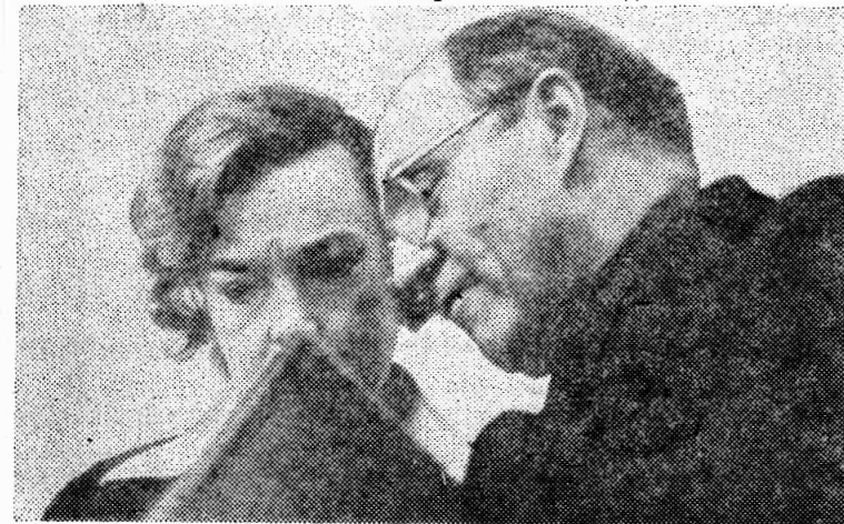
Сцена из спектакля «День-деньской»