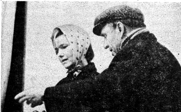
Сцена из спектакля «Варшавская мелодия»