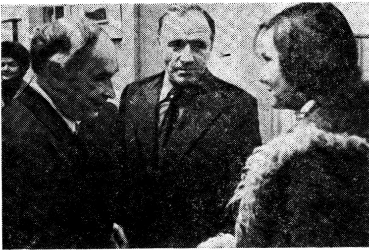
С актерами беседует академик И. М. Франк