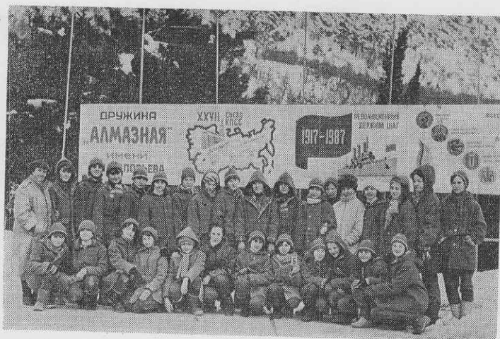
Коллектив старшего хора детской хоровой студии «Дубна» в «Артеке».

Мы уже сообщали, что старший хор детской хоровой студии «Дубна» был награжден путевой во всесоюзный пионерский лагерь «Артек» за активное участие в культурной программе XII Всемирного фестиваля молодежи и студентов в Москве. О том, какой след оставили дни, проведенные в «Артеке», рассказывают сами школьники.