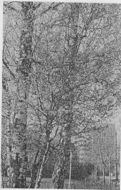
Весна идет.

знакомиться с несколькими выставками народного творчества.