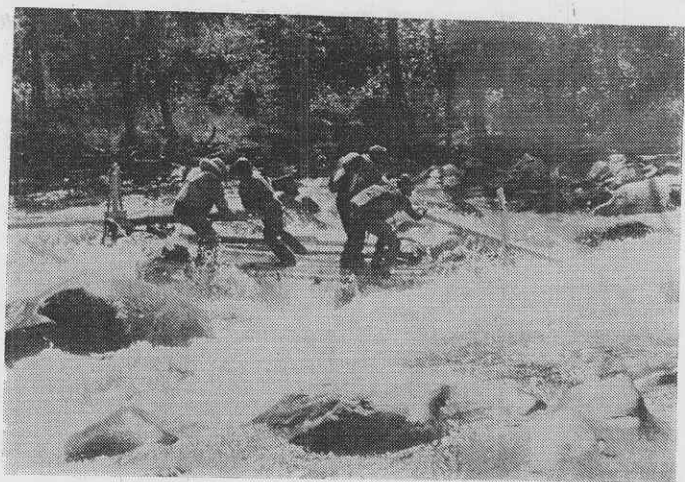
Сплав по сибирским рекам требует большого мастерства и опыта. На снимке: дубненские туристы на реке Оне на Алтае.

Эмоций хватало и у тех, кто сплавлялся на плотях. Вот серия порогов. Плот идет на отрицательной скорости, садится кормой на камень, резко кренится. Задние матросы «выбешиваются», спасают положение. Плот