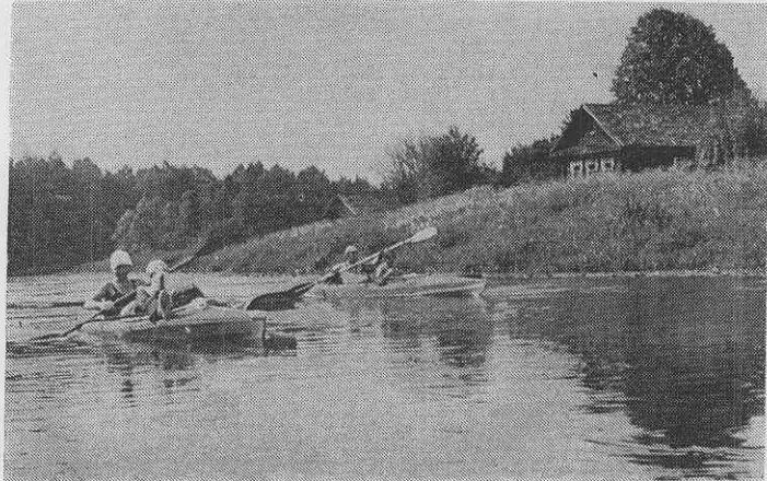
На Верхней Волге.