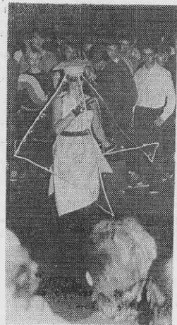
Из композиции «Английский дождь».

Рассматриваем с Алиной модели, созданные по мотивам русского костюма. «Здесь много традиционных элементов», — поясняет она. — Например, треугольная вставка на плече, свободный широкий крой, особая