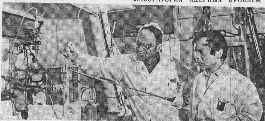
— ЛАБОРАТОРИЯ ЯДЕРНЫХ ПРОБЛЕМ